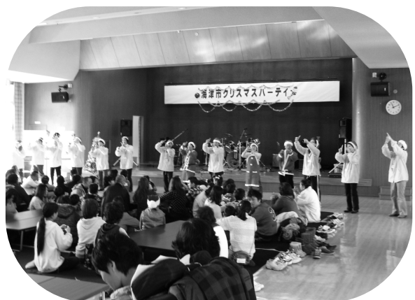
心身障がい児者クリスマス会