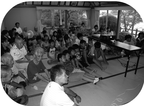
近隣助け合いネットワーク