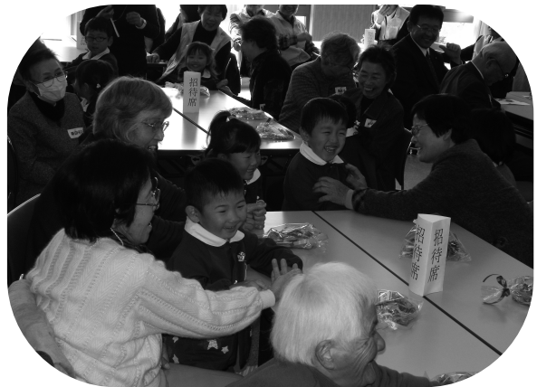
ひとり暮らし高齢者のつどい