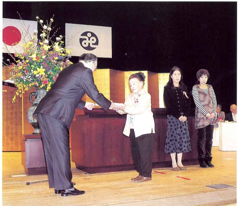
▲表彰を受ける「さくらんぼ」「レッツゴー」「ほうれんそう」のみなさん

また、当日の駐車場案内や参加者の受付などで、海津明誠高校の生徒12名にご協力をいただきました。生徒の皆さんありがとうございました。