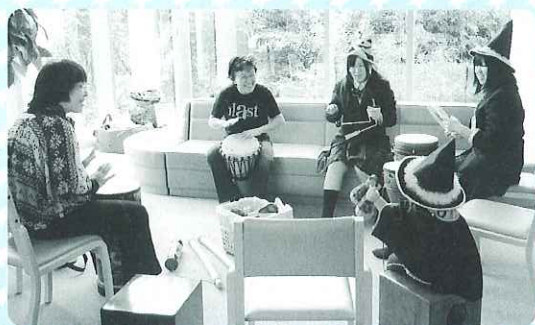
▲めずらしい楽器で、リズム遊び

南濃おもちゃの図書館「とろーる」は、初めての試みとして、「とろーるまつり」を開催しました。当日は200名程の参加者があり、子どもたちは手作りおもちゃや、似顔絵、シャボン玉などたくさんの遊びのコーナーで、一日を楽しみました。