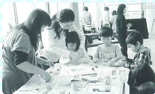
▲爪楊枝と板で、コマを作ったよ