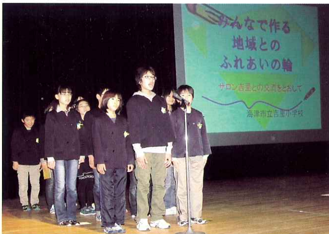
▲「サロン吉里」での交流の様子を発表しました。