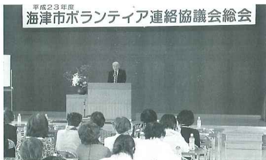
▲たくさんのボランティアさんが参加した総会の様子

海津市ボランティア連絡協議会総会が、5月15日(日)海津文化センターにて開催されました。総会では昨年度の事業報告と決算及び新年度の事業計画や予算が承認されました。