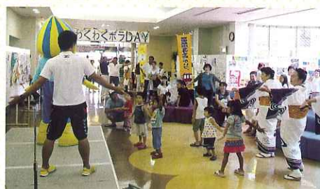
◀ 昨年のわくわくボラDAYの様子