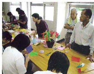
▲風車づくりの様子