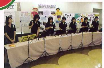
▲ハンドベル演奏の様子