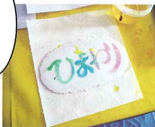
▲お絵かきせんべいづくり