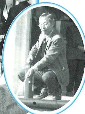
消火器訓練の様子

海津市ボランティア連絡協議会が11月28日(火)に広域防災センター(各務原市)に視察研修を行いました。当日は40名のボランティアが参加され、あらゆる災害のお話を聞いた後に、地震体験や消火器の上手な使い方を学び実際に体験をしました。体験された方は「今後、災害が発生したときのためにとても参考になった」という声も聞かれました。今回の研修では、災害について学ぶことはもちろんのこと、ボランティア相互の交流をさらに深めることができました。