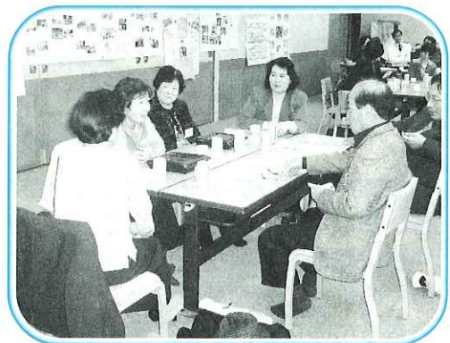
グループ交流の様子

12月7日(木)、南濃総合福祉会館で亀山市(三重県)のボランティアさんと海津市ボランティア連絡協議会の交流会が行われ、亀山市から約20名のボランティアさんが来訪されました。ボランティア活動についての意見交換を行い、また一緒に食事をとって交流をより深めることができました。地域性を活かし今後のボランティア活動の幅が広がることを期待します。