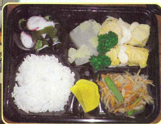
◀ 食事サービス・調理の様子