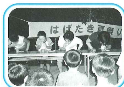
▲黒酢の早飲み大会

地域密着型の福祉施設として、地域の方と交流することにより、福祉の輪が広がっていきます。