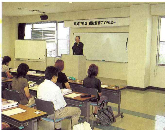
▲期待を胸に始まった開講式