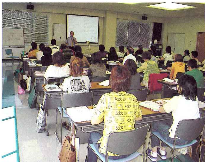
▲130時間、共に学ぶ受講生

終了後地域の貴重な人材として、様々な分野で活躍できるよう、ひとつひとつの講義でいろいろなことを吸収していただきたいと思います。