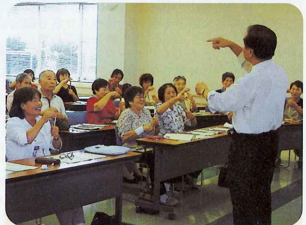
▲『チチンブイブイ』握った割り箸が上に下に