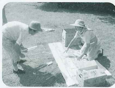
レクリエーションを終えたとお楽しみ景品が!!