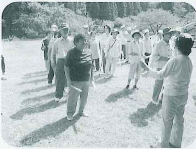
紅白の棒を使ったレクリエーション