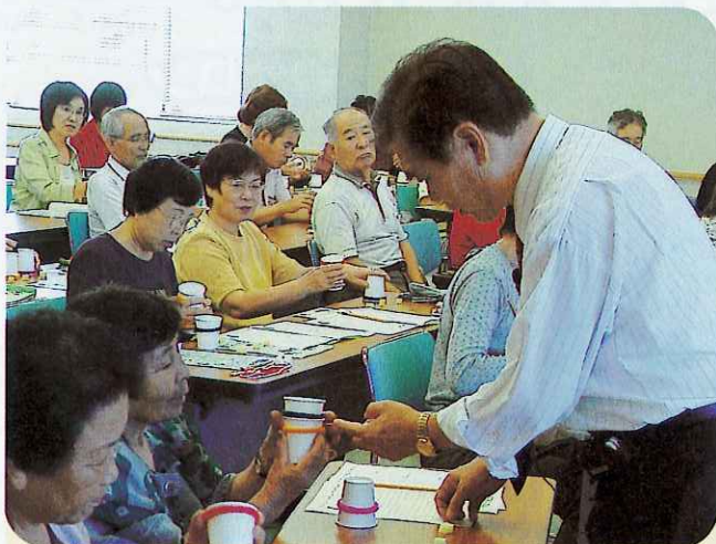
▲『あら!?不思議』紙コップ内のスポンジボールがどんどん増えていきます。