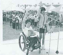
▲二人で元気よく、意気の合った選手宣誓をみせてくださいました

10月2日(日)長良川サービスセンター(福江)前河川敷で第10回長良川ふれあいマラソン大会が開催されました。