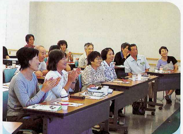
▲参加者に「わあ～」と感動と驚きを与える手品の数々

9月26日、癒し空間（第6空間）が開催され46名の参加がありました。ティッシュペーパーや割りばし、ハンカチ、紙コップなどの身近な品々を利用した手品や、種明かしに感心しながら見入り、早速実演に挑戦!!「説明通りにはうまくいかないね」と苦心する参加者が多く、会場のあちらこちらから笑い声があがっていました。