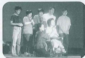
▲みんなで力を合わせてうたいます

このほど、海津市身障青壮年部主催による第2回障害者ふれあいコンサートが、海津市文化会館で開催されました。障害を持つ方も、そうでない方も一緒になって、バンド演奏やカラオケ大会で盛り上がりました。11組が参加をしたカラオケ大会では、岐阜盲学校生徒の皆さんが最優秀歌唱賞に輝きました。ハンディを感じさせない皆さんの歌声は、大変すばらしいものでした。