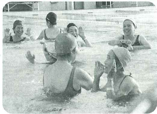
▶水と踊っているようです。

10月19日(水)、第7回癒し空間「水中リラクゼーション~プカプカ スイスイ 水曜日~」が開催されました。