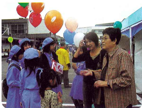
▲風船をもちながら「ご協力お願いしま〜す。」