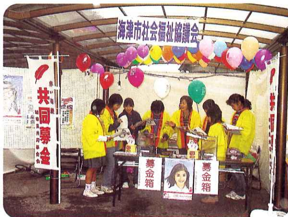
▲募金ボランティアを始める前に「ボランティアとは・・・」と熱心に話しを聞く中学校の生徒さんたち

10月22, 23日「海津商工産業感謝祭」29, 30日「いきいきフェスタ2005」11月3日「こん平田フェスティバル」において、ガールスカウト岐阜県第18団の皆さん、市内中学校の生徒さん、一般の方々により各会場をまわり、大変多くの募金をいただくことができました。