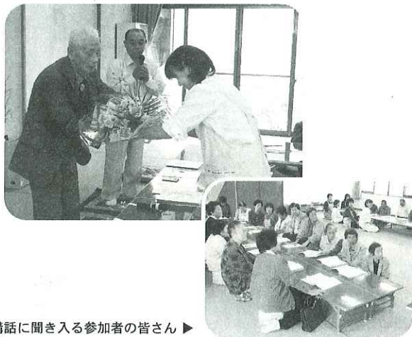
講話に聞き入る参加者の皆さん ▶

10月18日(火)平田地区岡自治会では地域のふれあい活動として地元の方を講師に迎え講話を開きました。