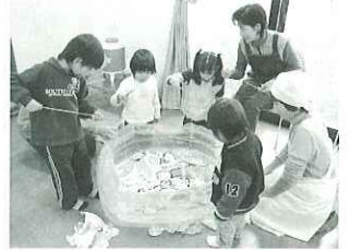
▲たくさん釣れるかな？

南濃地区松山台でふれあいいきいきサロン「悠 悠会」が開かれ、地区から多くの方が参加されま した。