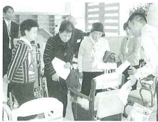
▲「うちにも似たようなタイプ買って 置いてあるわ。」

多くの方々に福祉 用具をより身近に感 じていただけるよう 、どなたでも見てい ただけるようになって います。ゆとりの森 来館の際は、ぜひ一 度ご覧下さい。