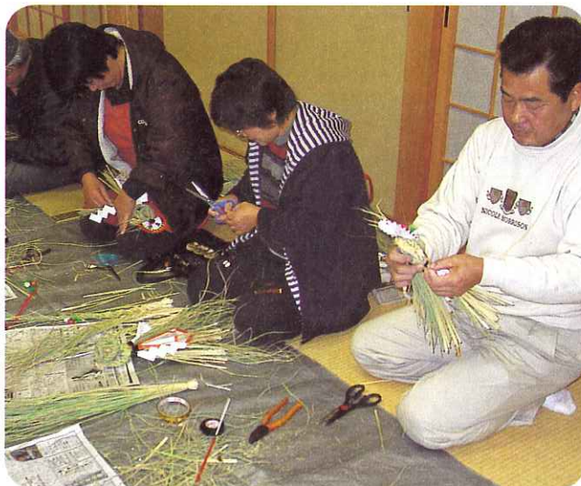
▲きれいに形を整えて最後の仕上げ