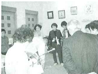
▲こちらのシャワーチェアは、安定 感はもちろん高さが使われる方に合わ せて調節ができるようになっています