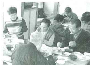
▲信州のおそばを頂きました