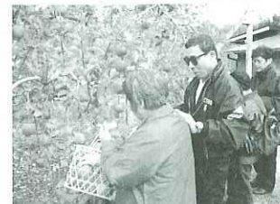
▲りんご狩りの様子

12月2日(金)視覚障害者社会見学を開催しました。今年は長野県の養命酒駒ヶ根工場を見学し、りんご狩りを楽しみました。