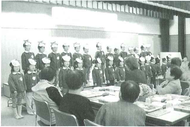
▲「園児たちは元気いっぱいの歌声です」

このほど、海津市平田地区において「お元気で す会～秋のつどい～」が開催されました。この会 は、ひとり暮らしの高齢者を招待して、食事をし たり、保育園児や高校生からの発表を見ていただ くことによって、楽しいひとときを過ごしていただ くものです。今年は、西島保育園の園児の皆さんが、 元気いっぱいの歌などを披露してくれました。参加 されたお年寄りも、どなたも大変喜ばれ、まるで元 気を分けていただいたようでした。