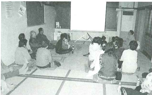
▲涙する方もたくさんみえました

五町自治会にて近隣助け合いネットワーク活動の一環として福祉映画会が開催されました。