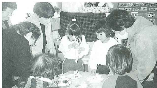
▲園児らと一緒にケーキを作りました

12月15日(木)、吉里幼稚園にて田中お達者会の皆さんと吉里幼稚園児らのふれあいクリスマス会が行われました。