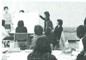
▲平常時、災害時に出来ることは？

ホームヘルパー養成講座に続き、福祉教育アカデミー専門課程(福祉教育サポーター・災害救援サポーター)養成講座が12月1日～21日までありました。2講座とも大学教授や専門家の方々を招き、わかりやすく、すぐにでも役に立つ講義とグループワーク、体験学習をしました。