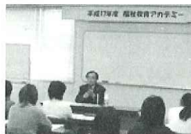
▲福祉教育とは・・・