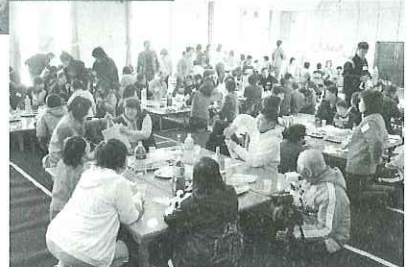
メリークリスマス!!

12月18日(日)、すみれの会(心身障害児者を持つ親の会)、大垣養護学校海津地区PTA、海津市社協の三者共催による海津市クリスマスパーティーが開かれました。