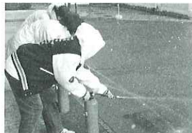
▲県防災センターにて消火訓練