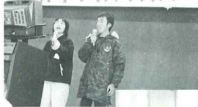
雪を吹き飛ばす程の熱唱