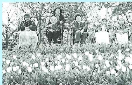
◀一面のチューリップに春を感じます