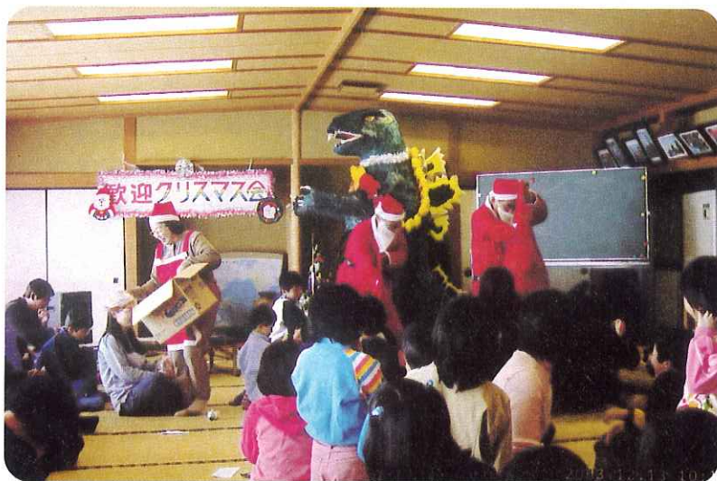
▲子ども会と一緒に楽しいクリスマスパーティー