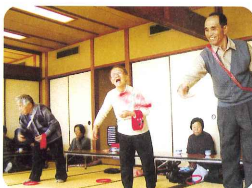
▲輪なげも皆でやれば笑顔があふれます