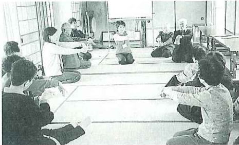
▲体全体を動かし、ゆっくりストレッチ

海津地区長瀬自治会において近隣助け合いネットワーク事業の一環として健康体操教室が開催されました。