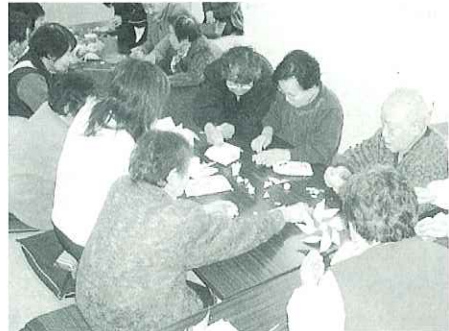
▲紙ねんどを使った工作

平田地区高田自治会では、毎月一回集会所にてふれあいいきいきサロンが開かれています。