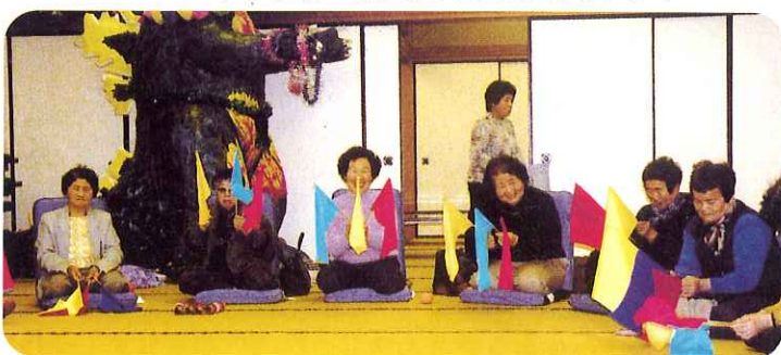
▲旗上げゲームにも熱が入ります

海津地区帆引新田自治会では、毎月第3日曜日にふれあいいきいきサロン花水木が開かれています。