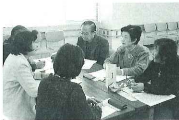
▲熱心に意見を交わす相談員

なんでも相談センターの心配ごと相談員、結婚相談員が集まり、相談事業の1年間を振り返り、問題点や課題への対応について研修を行いました。