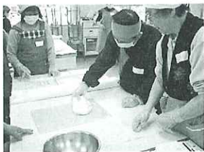
▲「日頃のうっぶんを込めて!!!」 (ガス抜き)