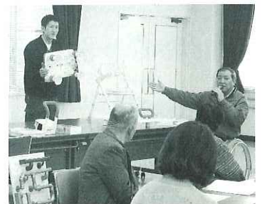
▲後半の『便利な福祉用具の紹介』 新しい用具で参加者も興味津々