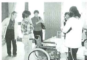
▲サロン終了後、負担の少ない移動方法を紹介

サロンでは、介護をしてみえる方々と一緒に食事をしながら、介護生活について語り合います。介護者はゆっくりと食事を楽しんだ後、日々の不安、悩み、疑問などありのままに打ち明けあいました。