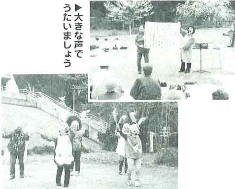
▲ボランティアさんによる楽しいダンス