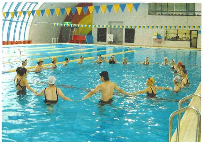
▲輪になってダンス、水との共演