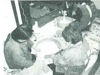
▲たまねぎとホウ酸をまぜて作ります