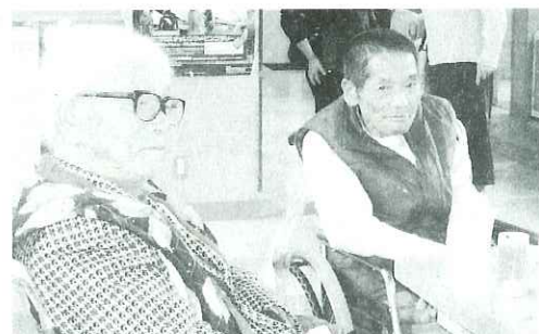
◀リラックスモードです。

道の駅『月見の里 南濃』へ遊びに行きました。利用者の方々は初夏の景色とお買い物を楽しまれました。