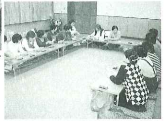
▲食事をとりながら楽しいおしゃべり会