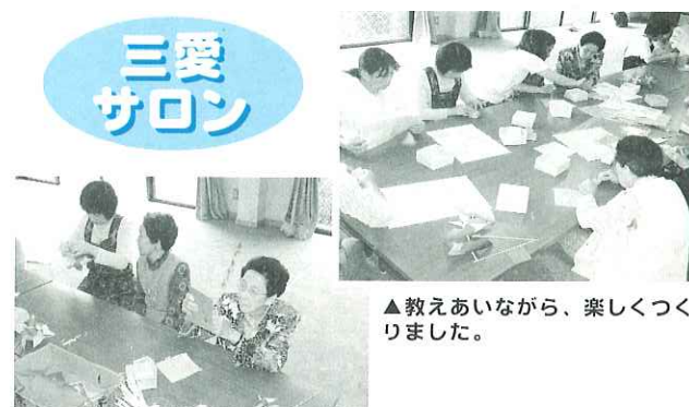
▲教えあいながら、楽しくつくりました。