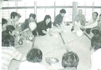
▲認知症予防についてのお話