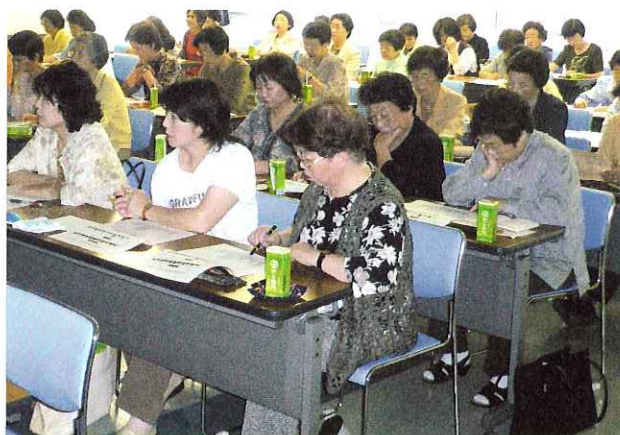
▲これからの食事づくりに対して参加者の気持ちも高まってきたようでした。

ノロウイルスやカンピロバクターは感染力が強く少数の菌でも感染すること、調理時には手洗いを徹底して行い予防することの重要性などを勉強しました。