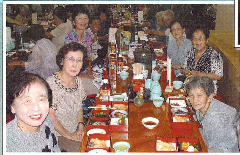
▲みんなでのんびりした時間を過ごしました。