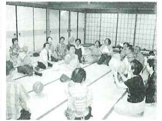
▲白熱したプレーも出ました。