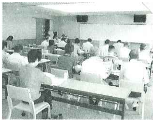
▲皆さん研修を熱心に受けていました。