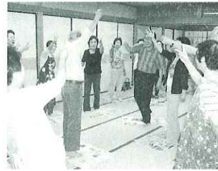
▲新聞とジャンケンを使ったレクリエーション