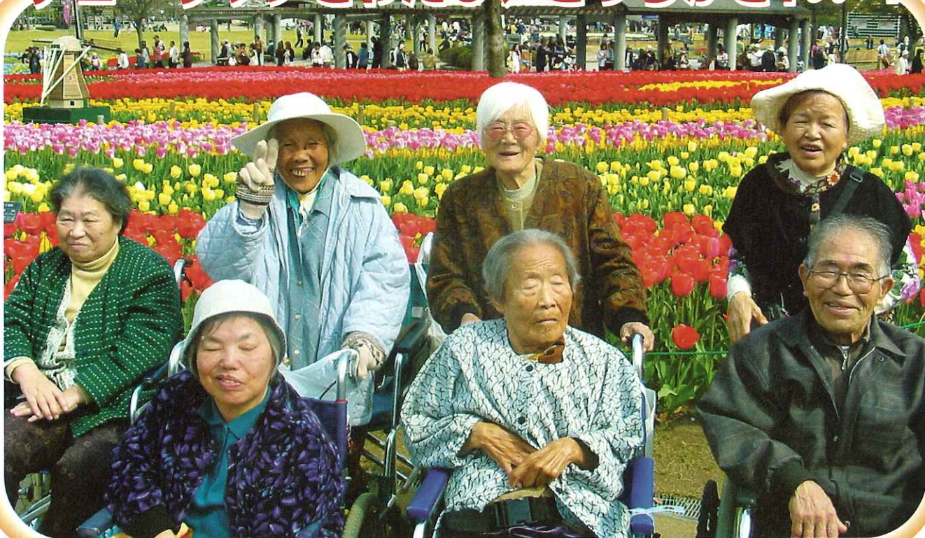
▲木曾三川公園チューリップ祭 2007 デイサービスセンター南濃

4月9日～13日の5日間、デイサービスの利用者さんと木曾三川公園チューリップ祭に行ってきました。利用者さんは、ボランティアさんが押す車いすに乗り、園内に咲き誇っている色とりどりのチューリップを鑑賞し、出店で軽食を楽しみました。桜もまだ咲いていて、春を満喫することができました！