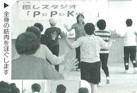
全身の筋肉をほぐします