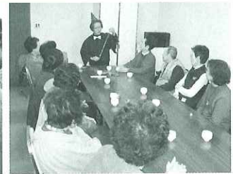
▲とっておきのマジックでみなさんを驚かせました。

3月20日(火)平田地区本町自治会でふれあいいきいきサロン「ひまわり会」が開催されました。