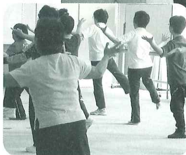
おとつとバランスキープ