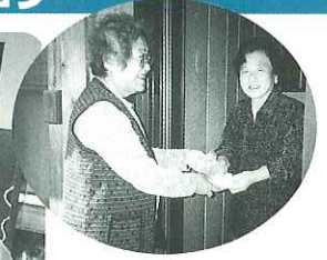
▲ひとり暮らし高齢者の方へプレゼント

団子作りの後はお楽しみのティータイムで今年一年の予定やサロンのみんなでやりたいことを話し合っていました。