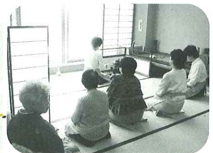
▲茶道のお稽古の様子

茶道は、五感を十分に働かせるとともに、きれいな姿勢や所作が身につきます。一方華道は、四季折々の樹枝や草花などを花器に挿し、美しさを表現します。どちらの講座も礼儀作法を大切にする日本の伝統的な芸術です。静寂な空間の中で精神を統一し、和の雰囲気にも癒されにきてください。