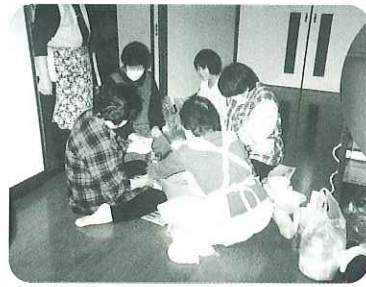
▲ゴキブリ団子作りの様子

4月21日(土)船渡自治会にてふれあいいきいきサロン「ほほえみ」が開かれました。