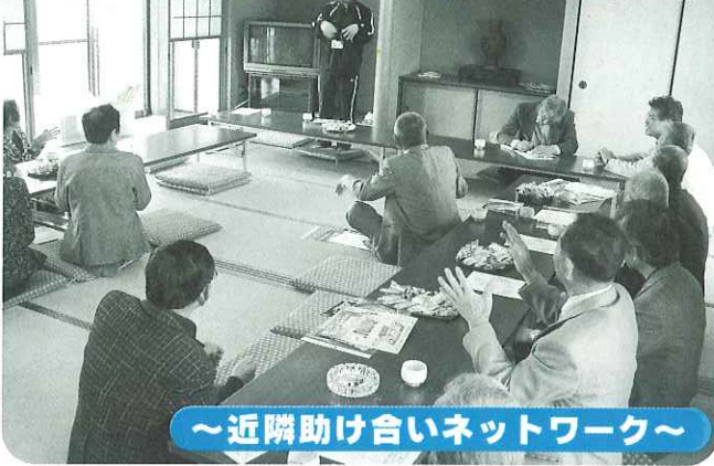
▲楽しいレクで盛り上がりました。