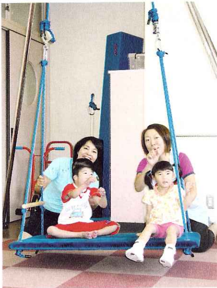
▲おっきなプランコゆーらゆー

この夏、共同募金配分金（地域子育て支援事業）で、感覚統合訓練をより充実させるためにサポートフレーム（感覚統合訓練機器）を購入させていただきました。発達の基礎となる5つの感覚を刺激して、バランスよく発達していけるように活用していきます。