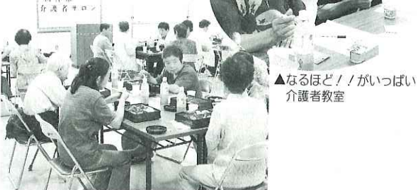
▲なるほど! / がいっぱい 介護者教室