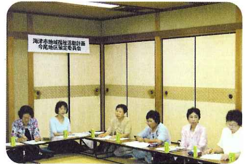
▲福祉の充実のために意見交換をします

各地区の委員会では、皆様からのご意見をお待ちしていますので、お近くの社会福祉協議会窓口までお寄せください。