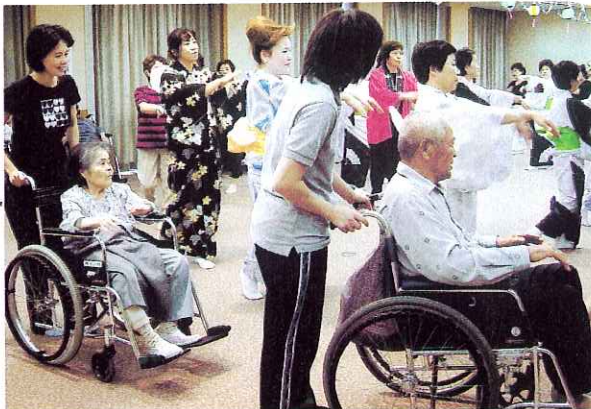
▲みんなで輪になって踊りました

7月30日にゆとりの森で行われた盆踊り大会に、デイサービスセンター南濃とデイサービスセンター平田の利用者の方々が参加されました。とても暑い日でしたが、利用者の皆さんはとても懐かしそうに、南濃音頭などを元気に踊られました。ボランティアの皆さんと輪になって踊る姿は、とても和やかな雰囲気、楽しいひとときを過ごすことができました。