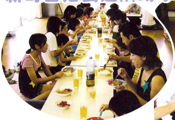
▲おいしいカレー!!おかわり~♪