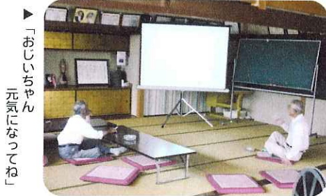
▶「おじいちゃん 元気になってね」