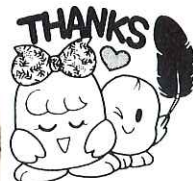
共同募金配分事業