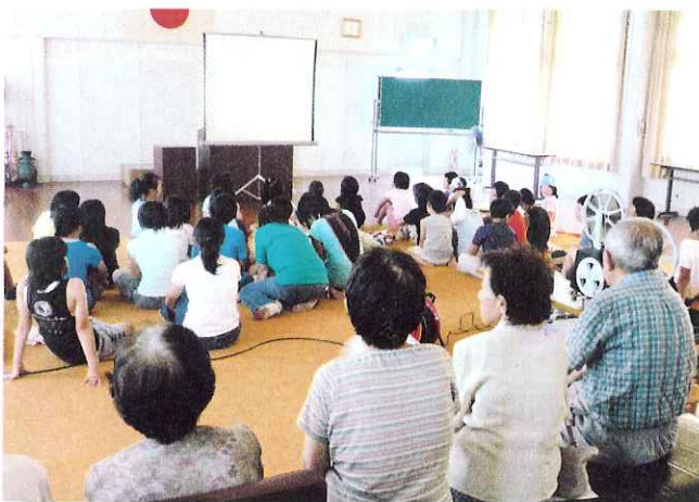
▲子どもからお年寄りまでたくさんの方が参加しました

今回は福祉映画「おじいちゃん元気になってね」を上映し、「子どもとおじいちゃんの温かい絆」をテーマにした物語に涙する方もみえました。映画の後は食事をしながら楽しくおしゃべり会を行い、サロンを締めくくりました。ふれあいいきいきサロンは月1回開催され、どなたでも気軽に参加できます。