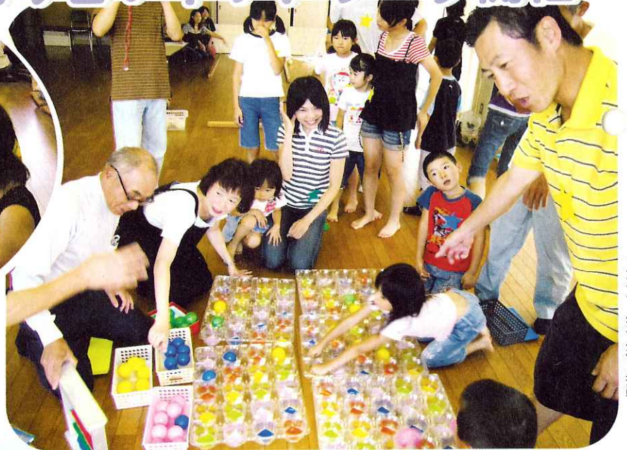
◀カラフル玉入れに挑戦!