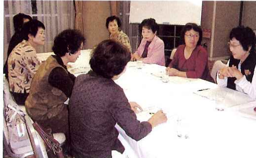
▲真剣な表情、思わず身ぶり、手ぶりも・・・

交流会では時間が経つのを忘れ、活発に意見交換「同じ立場だからこそ分かり合えた、気兼ねなく話し合えた。」と気持ちの整理、気分転換をして頂けたようです。