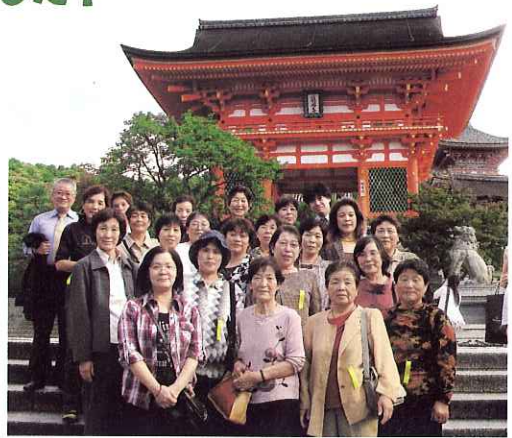
▲清水寺前にて、集合写真♪