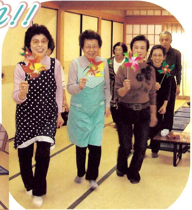
上手くまわるかな!?

10月23日(火)上本町スズランいきいきサロンが行われました。ボランティアさん手作りのカレーをみんなで美味しくいただいた後、折紙を使った「風車作り」に挑戦。目を細めながら、針金に小さなビーズやストローを通して・・・できた♪完成した風車を片手に思わず走り出し、回転する風車の彩りを楽しみました。