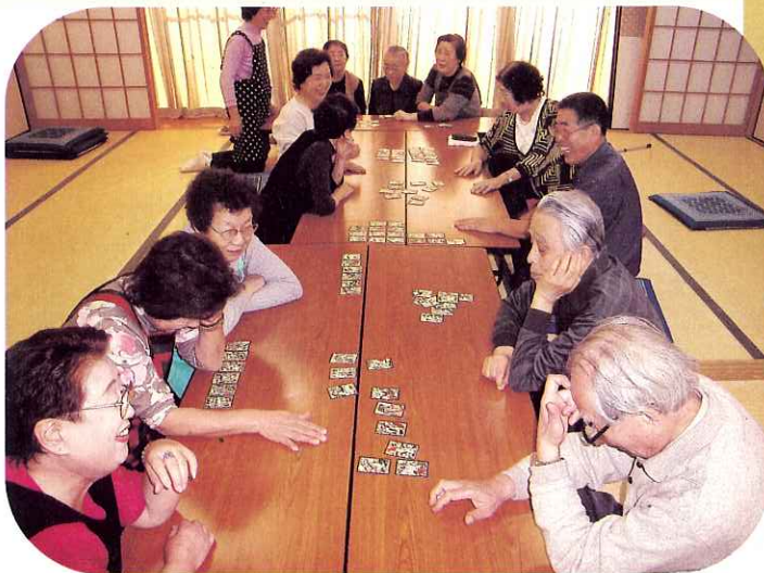
▲こんな所にあつたのか～。

昔懐かしい「いろはカルタ」にも挑戦! 唄を讀む声に負けない大きな声で『ハイッ!!』手にも声にも力が入ります。手と手が重なり合う白熱した場面も(笑)見られました。