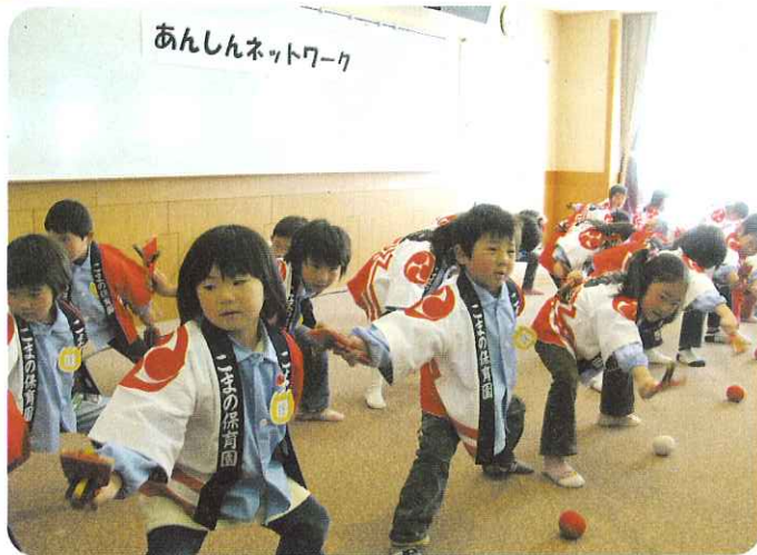
▲園児たちの力強いよさこい

2月15日(金)南濃地区ひとり暮らし高齢者のつどい「あんしんネットワーク」を海津市赤十字奉仕団と社協の共催で行いました。