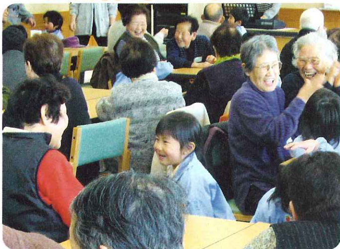
▲げんこつやまのためきさん♪のリズムにのって