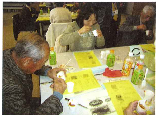
▲栄養補助食品を試食中

在宅で介護をしている方々が集まり、介護相談や、情報交換をする交流の場として介護者サロンを開催しています。