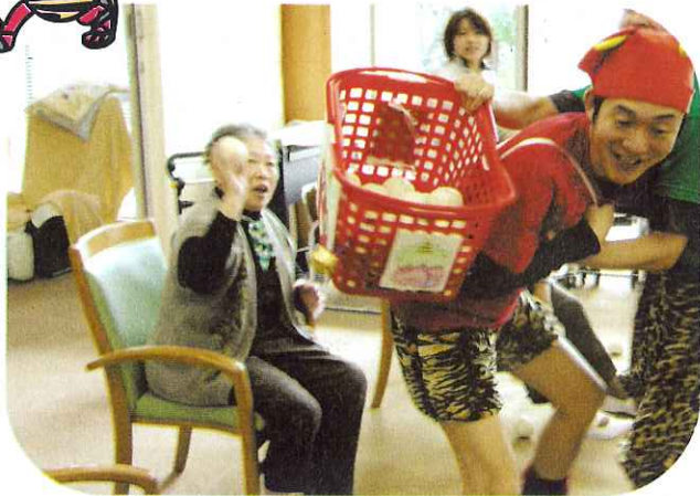
▲レクリエーションで節分の豆まきをしました