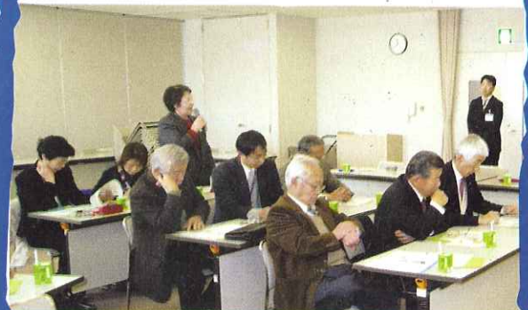
▲食事サービスの配食を児童が行っていることについて経緯を尋ねている様子