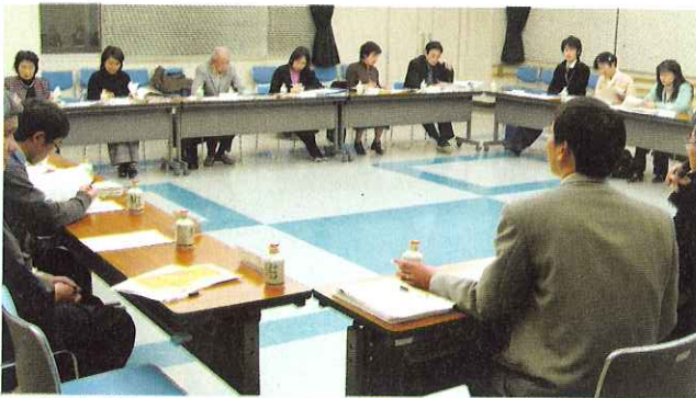
▲計画の骨子について意見を交わしています

現在、海津市地域福祉活動計画の策定のため、策定委員会で検討を重ねています。地域住民が幸せに暮らすためには、人と人とのつながりが大きな役割を担うことやあたたかい助け合いや支え合いのできる地域作りを進めていきたいと委員会の中では、活発な意見交換がなされています。