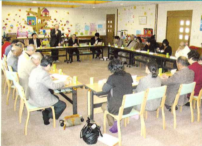
▲市内の福祉活動についての情報交換