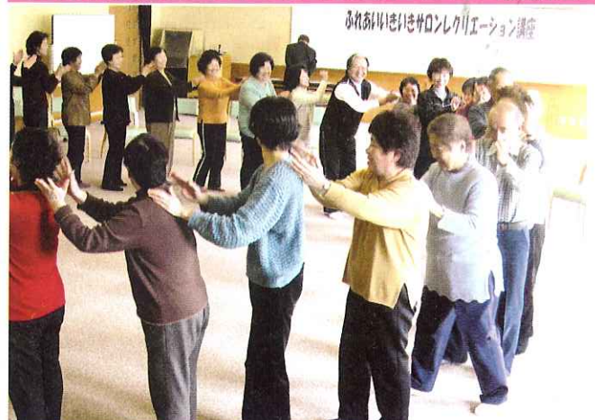
▲リズムに合わせて肩たたき

2月22日（金）市内のふれあいいきいきサロンボランティアを対象にレクリエーション講座を行いました。