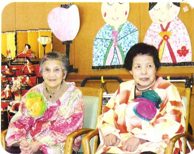
▲素敵なおひなさまになりました。

デイサービスセンター南濃では、2月末〜3月3日にかけてひな祭り会を行いました。おひなさまの衣装を身にまとい、写真撮影をしたり、歌や踊り、職員の出し物など、色々な催し物で楽しみました。ゲームで一生懸命熱中している姿や、大きな笑い声がとても印象的な楽しい会となりました。