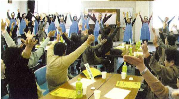
▲「おさかなくわえた〜」の曲に合わせて手話をしました。

3月12日(水)、お達者です会〜海津地区ひとり暮らし高齢者のつどい〜が開催されました。