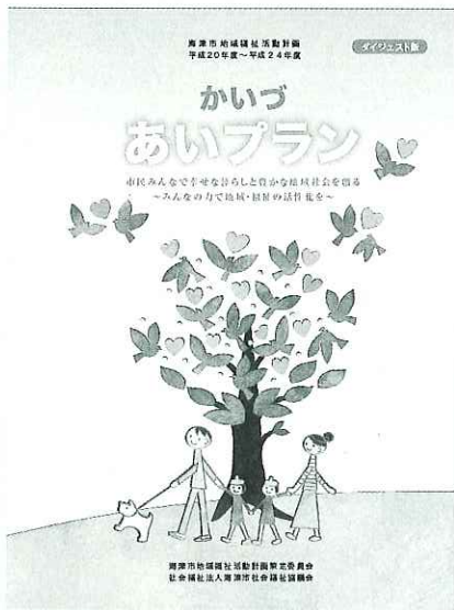
▲あいプランは4月の広報誌とっしょにお届けしています。