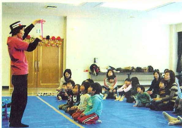
▶マジックショーにみんな釘付け