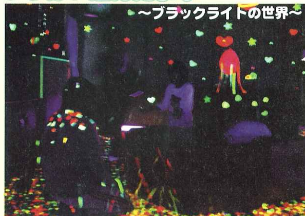
◀ 幻想的なブラックライトの中で...

最後に、子どもたち一人ひとりに手作りのメダルを渡し、今年一年の成長を喜びながら、4月からまた新しい目標に向かって頑張っていこうね!と確認し合いました。