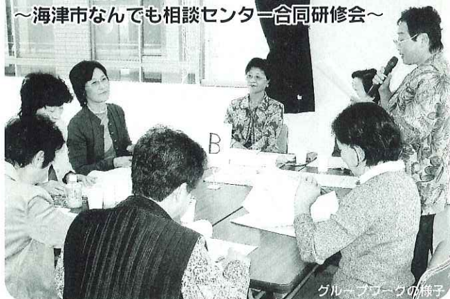
▲相談員の熱意が伝わってきます。

毎月開催されている「海津市なんでも相談センター」の各相談員（心配ごと・結婚）による合同研修会が開催されました。これまでの現状を踏まえ、今後の課題や対応について、積極的な話し合いが行われました。