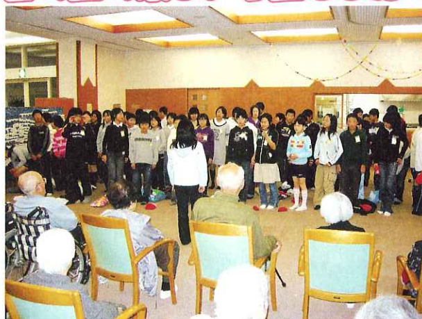
◀ 心のこもった歌声に聴き入って...

3月14日(水)、高須小学校の訪問会が行われました。6年生の生徒さんたちによる劇や合唱、折り紙作りなど、利用者みなさんといっしょに楽しい時間を過ごしました。