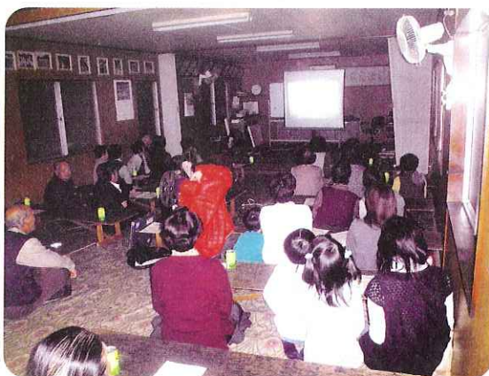
▲感動の映画にみんな真剣です。

本事業は地域の見守りネットワークを形成することを目的に、近隣助け合いネットワーク事業の一環として行われました。