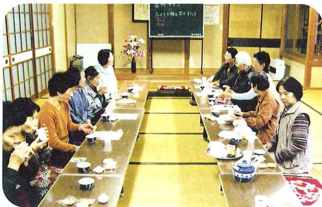
▲名前は「若竹サロン」にしましょう！