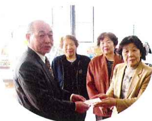
海津市老人クラブ連合会女性部よりいただきました寄附金を、「はばたき」の駐輪場修繕に充てさせていただきました。