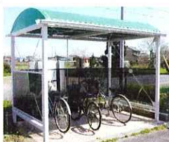
▼整備された「知的障害者通所授産施設はばたき」駐輪場