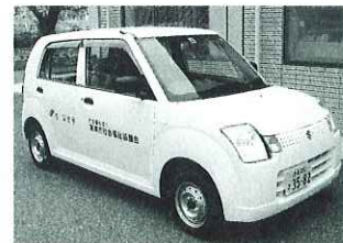
▲購入した赤い羽根号

赤い羽根共同募金の配分を受けて、軽自動車を購入させていただきました。福祉向上のため、有効に活用させていただきます。ご協力ありがとうございました。