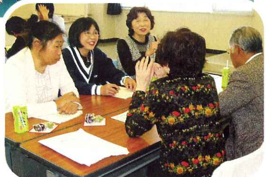
▲“うちのサロンは〇〇が好評です!!”と自慢しました。