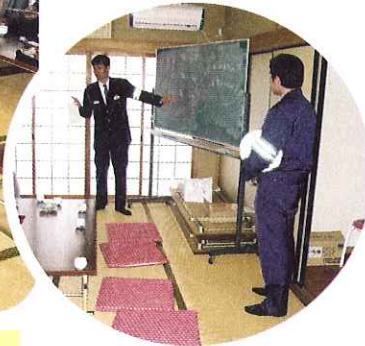
▲一瞬の油断が命とります。