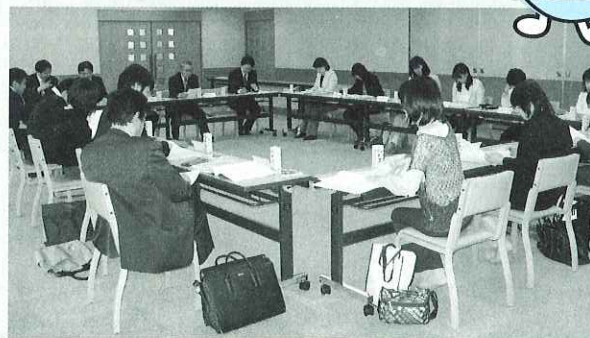
▲今年度の事業について話し合いました。

4月24日（木）、市内全学校（15校）の福祉教育担当者へ出席いただき、福祉協力校合同打合せ会議を開催しました。福祉協力校事業は小・中学校及び高校の生徒を対象として、ボランティア活動や日常の身近な福祉活動を進めるなかで、福祉の心を深める目的で行っています。会議では各学校の取り組みについて意見交換し、事業の進め方を話し合いました。