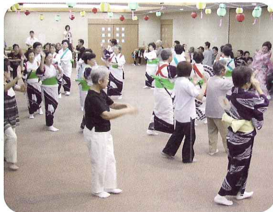
◀みんなで輪になってたのしく踊りました！

8月5日(火)、ゆとりの森において行われた盆踊り大会に、デイサービスの利用者のみなさんが参加されました。さまざまな踊りのほかに、婦人会の方々の太鼓・銭太鼓の演奏や、歌謡ショーなど、大勢の人たちでにぎわいました。利用者の方々も、歌や踊りを楽しまれ「今日は昔を思い出せて、本当に楽しかったよ!!」と笑顔で話されました。