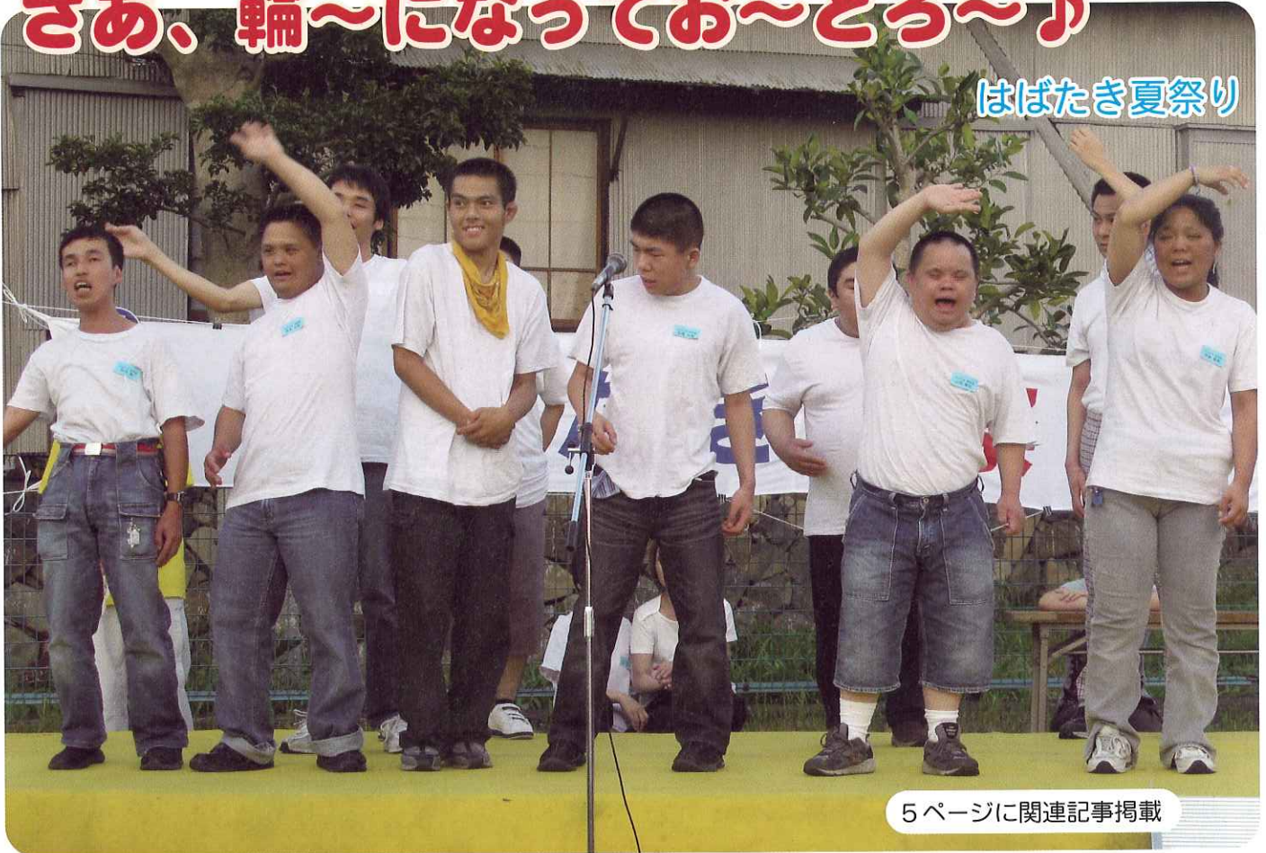
5 ページに関連記事掲載