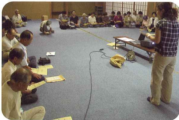
▲認知症について理解を深めました。

7月24日(木)、野寺自治会にて福祉映画会が開催されました。会には40名の参加者が集まり、中学生がボランティア活動をきっかけにお年寄りとの交流を深めていく様子を描いた福祉映画「へんてこなボランティア」を鑑賞。人とのふれあいの大切さについて改めて考えることができました。また映画観賞後は、介護予防教室として、介護予防の重要性や、認知症について知識を深めました。