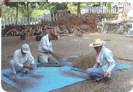
▲竹ぼうき作りの様子