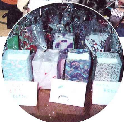
▲心をこめて作りました!