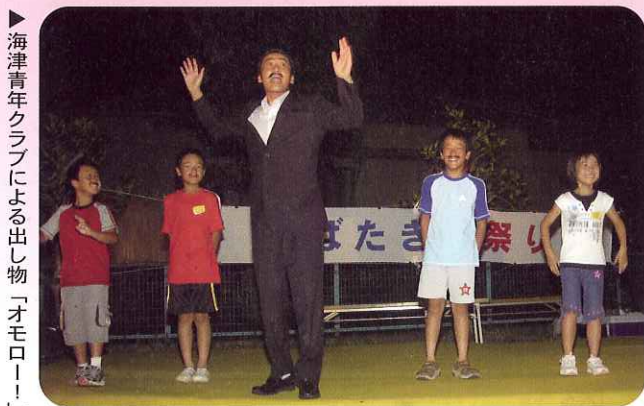
▶海津青年クラブによる出し物「オモロー！」