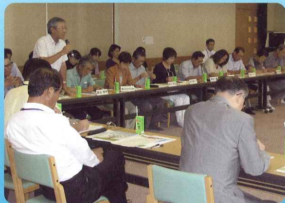
▲活発な意見交換がされた推進委員会

海津市地域福祉活動計画「かいづあいプラン」を推進していくため、第1回かいづあいプラン推進委員会が開催されました。委員会では、計画の重点施策である地域福祉懇談会の開催や地区社会福祉協議会の創設を中心に、意見交換がなされました。区や自治会活動との関係や、人材や財源の確保など、多くの課題が指摘されました。今後は、推進委員会内で、さらに研修を進めていくことになりました。