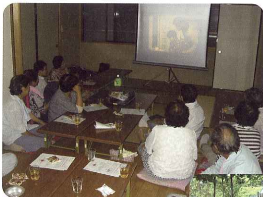
▲家族の絆の大切さに心打られました。