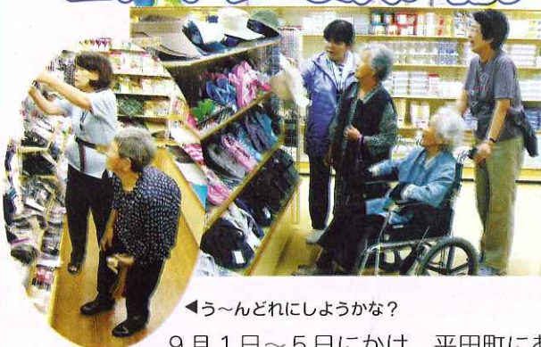
▲楽しい買い物でした