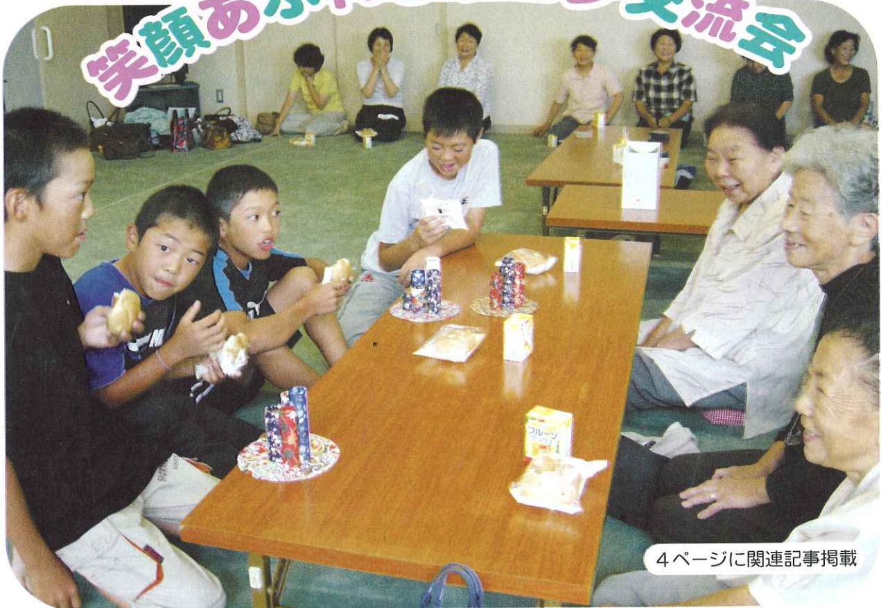
4ページに関連記事掲載