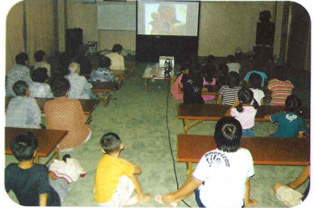
◀皆で福祉映画を鑑賞しました。

会を楽しみにして下さる参加者のために、わたしたちボランティアは一生懸命がんばります。