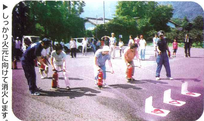
▶しっかりと火元に向けて消火します。

この活動を通して、住民同士の支えあい(共助)と家族同士の支えあい(自助)の大切さを学ぶことができた有意義な会となりました。