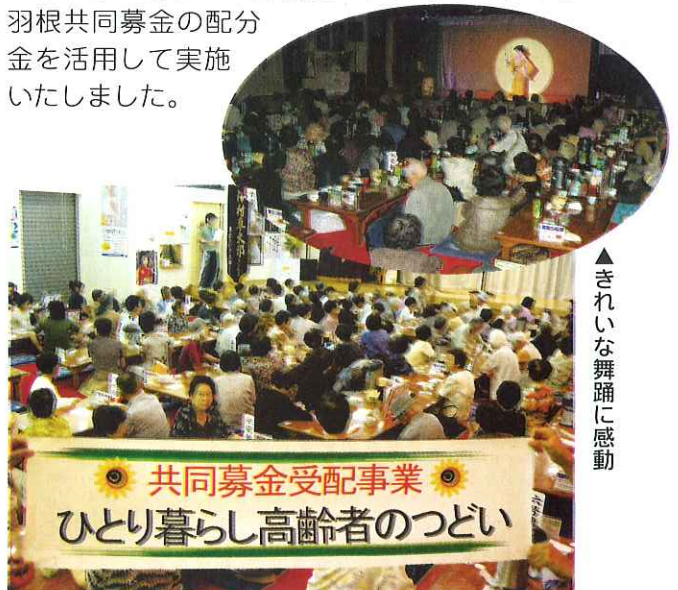
▲きれいな舞踊に感動

本事業は皆様より御協力いただきました、赤い羽根共同募金の配分金を活用して実施いたしました。