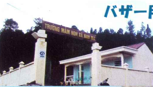
▶完成した幼稚園の様子▶

わたしたちは、市内の中高生と一緒に、ベトナムに幼稚園建設並びに文房具を提供しております。