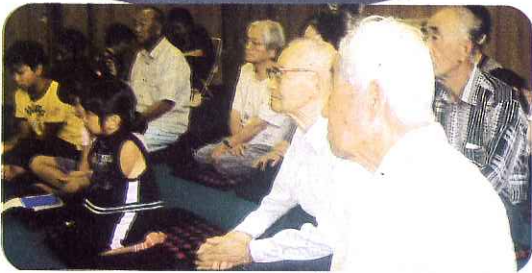
この記事は、いきがいサロン仏師川より寄稿していただきました