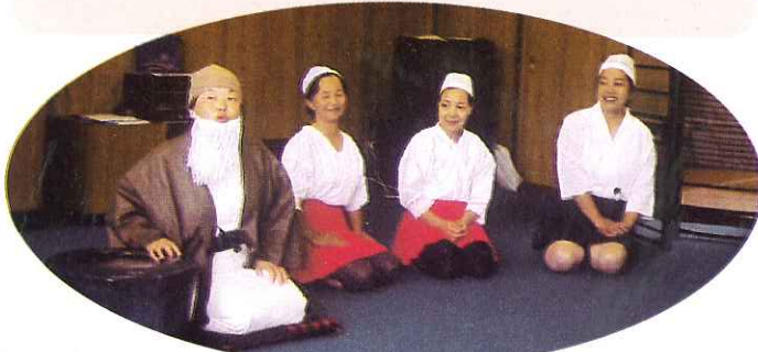
▶サロンボランティアの手作り演劇を楽しみました。