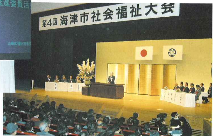
▲会場は超満員となりました。