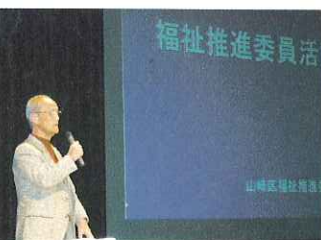
◀福祉推進委員活動発表の様子