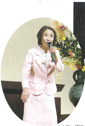
▲力強い講演でした。

海津市の明るい未来を感じ、家族の絆の大切さを改めて認識させられる大会となりました。