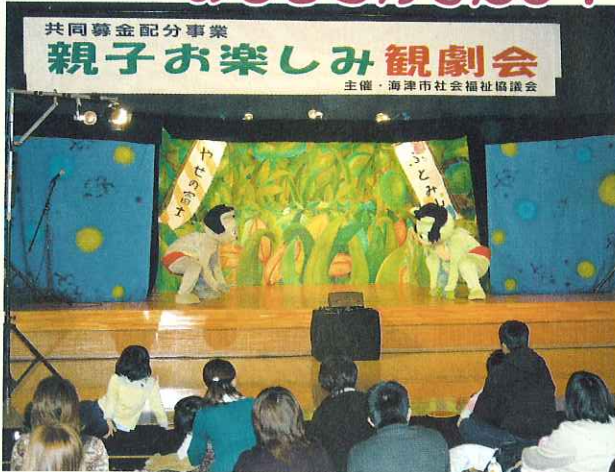
◀どっちもがんばれ!

12月7日(日)、市内の3つの児童デイサービスに通う子どもたちと特別支援学校に通う児童を対象に『親子お楽しみ観劇会』を海津市文化センターで行いました。