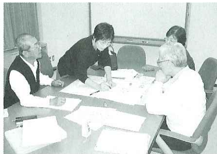
見守りマップを作成し、民生委員との懇談