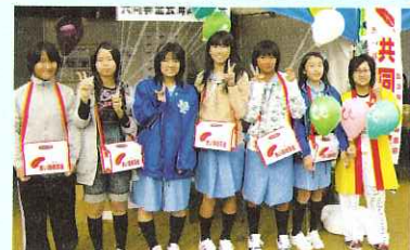
▲商工祭での募金活動(ガールスカウト岐阜県第18団)