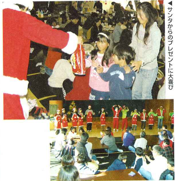
◀サンタからのプレゼントに大喜び

12月14日(日)、心身障がい児者クリスマスパーティーを開催しました。この会はすみれの会(障がい児を持つ親の会)と大垣特別支援学校海津地区PTA、海津特別支援学校PTAと共催で行っており、今年には188名(スタッフ含む)の参加がありました。会では海津市レクリエーション協会によるクリスマスソングに合わせて体を動かすレクや海津青年クラブによる「エンタの仏様」と題したお笑い芸人のモノマネを見て盛り上がりました。また、昼食をはさんで大垣特別支援学校と海津特別支援学校の先生による出し物があり、楽器の演奏に合わせて歌ったり、パネルシアターを観たりして楽しみました。最後にはサンタクロースからのプレゼントと養老ライオンズクラブからの記念品を受け取り、子ども達の笑顔溢れる会となりました。