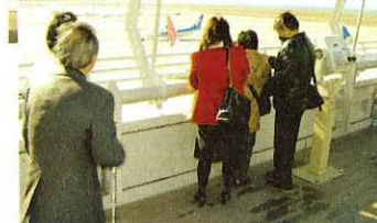
◀飛行機を間近で見学できました

12月10日(水)、視覚障がい者のつどいを岐阜県視覚障害者協会海津支部との共催で開催しました。今年には参加者23名と中部国際空港「セントレア」へ行きました。参加者はセントレアでスカイデッキに上がり、ガイドヘルパーによる説明を聞きながら、飛行機の離着陸の音の迫力に驚いていました。また、昼食では新鮮なお刺身や大きなエビフライなど美味しい海の幸を食べながら、楽しく交流しました。帰りの車中で参加者は「大変楽しい会になりました。また来年も元気な姿で会いましょう。」と声を掛け合っていました。