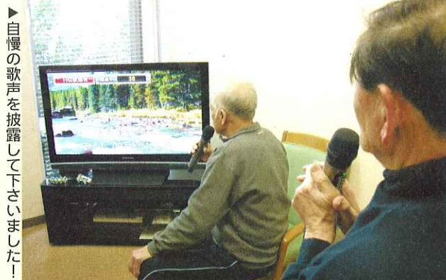
▶自慢の歌声を披露して下さいました!

田口福寿会様より社会福祉充実の目的で当協議会に助成金を頂き、デイサービスでのリハビリの一環として認知症予防に効果があるといわれるカラオケセットを導入させていただきました。