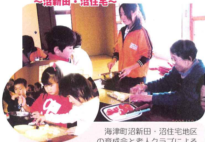
◀子どもから高齢者までふれあいました

海津町沼新田・沼住宅地区の育成会と老人クラブによるケーキ作りと昼食会が開催されました。