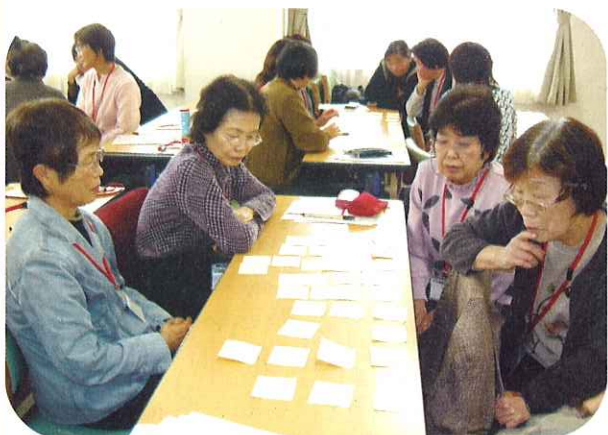
◀グループワークの様子

その後、今と昔の子育て事情の違いや親のニーズについての話を聞き、支援される人への立場に立ったサポートの大切さを改めて認識しました。