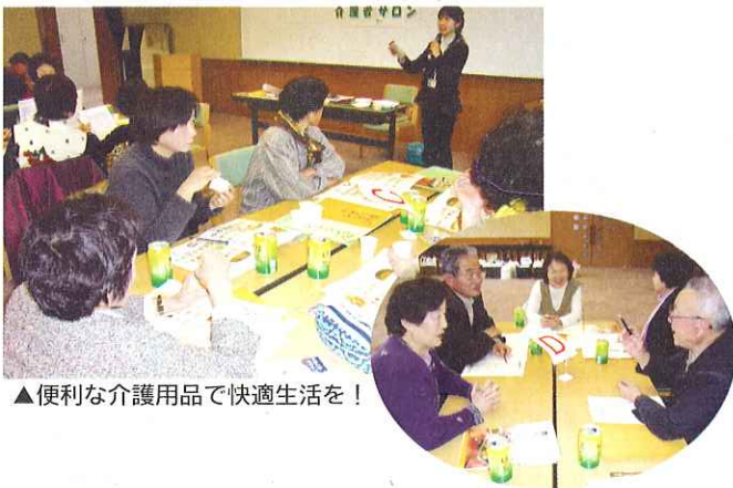
▲便利な介護用品で快適生活を!