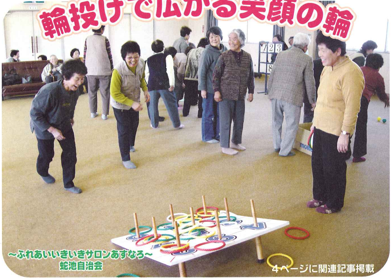
～ふれあいいきいきサロンあすなろ～ 蛇池自治会