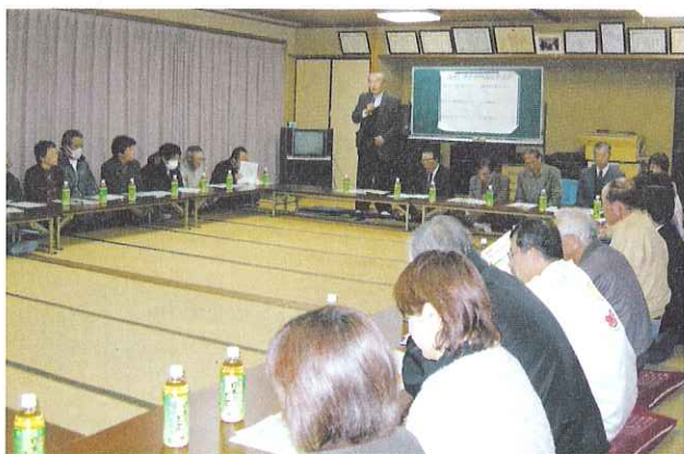
▲各会場で熱心に話し合いがなされました。

高須地区では、5つのブロックに分かれて、地域福祉懇談会を開催しました。自治会役員や福祉関係者、教育関係者など地域の中の様々な役員と一般住民が一堂に集まり、これからのまちづくりについて意見交換をしました。子どもの見守り活動や地域住民の交流、福祉活動などについて、多くの意見が出されました。懇談会で頂いた意見を基に、地域での取り組みを考えていくことになりました。