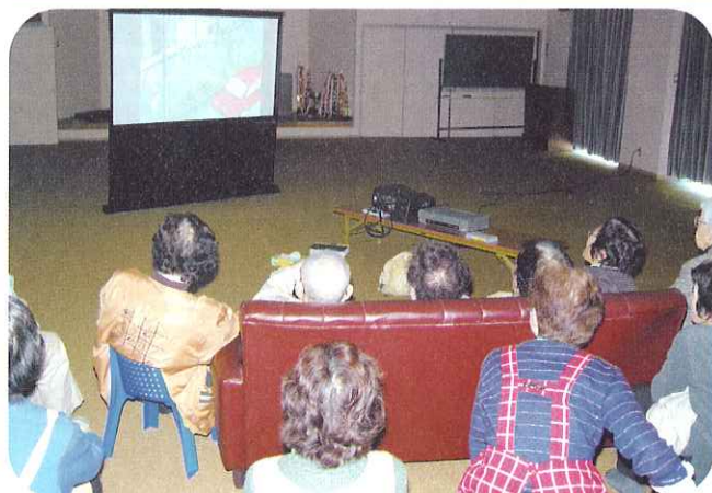
◀福祉映画に感動しました

2月4日(水)、平田町蛇池地区でふれあいいきいきサロンあすなろが開催されました。