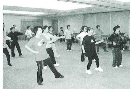
▲平成20年度後期コースの様子

〈講師〉 健康運動指導士 〈会場〉 海津総合福祉会館ひまわり 2階研修室 〈対象者〉 海津市内在住の65歳以上の方 定員40名 ※初めてお申込みの方を優先させていただきます。 ※定員に余裕のある場合は61歳以上の方もご参加いただけます。