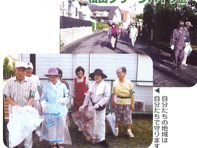
◀見守りを兼ねた清掃活動