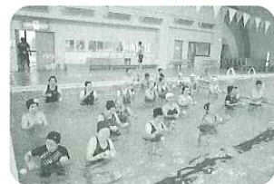
▲水中お手玉で前進!!

〈講 師〉 AFAA公認プライマリーインストラクター/公認スポーツ指導者 〈会 場〉 海津市市民プール 海津町萱野204-1 〈対 象 者〉 海津市内在住の65歳以上の方 定員40名 ※初めてお申込みの方を優先させていただきます。 ※定員に余裕のある場合は61歳以上の方もご参加いただけます。