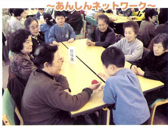
～あんしんネットワーク～

最後に参加者同士で「また、来年も元気にお会いしましょう」と声を掛けあい、会を閉じました。