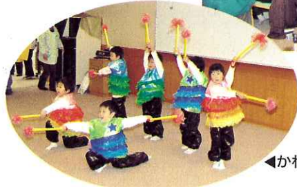
◀かわいい園児たちの踊り