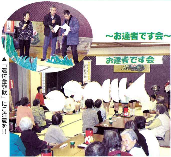
▲「還付金詐欺」にご注意を!!