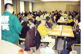
▲会場全体が“満点大笑い”

会では庭田保育園児の歌と踊りを披露してもらった後に園児との手遊びや肩たたきをし、交流を深めました。また、赤十字奉仕団の皆さんによる手作り弁当を昼食にいただき、岐阜経済大学落語研究会OBによる演芸を鑑賞し、楽しい会を閉じました。