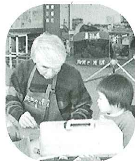
◀おもちゃ病院の先生

受 付 月～金 8:30～17:00 場 所 南濃総合福祉会館ゆとりの森 治 療 代 100円～300円程度(部品代) おもちゃドクター 長島おもちゃ病院(三重県桑名市)