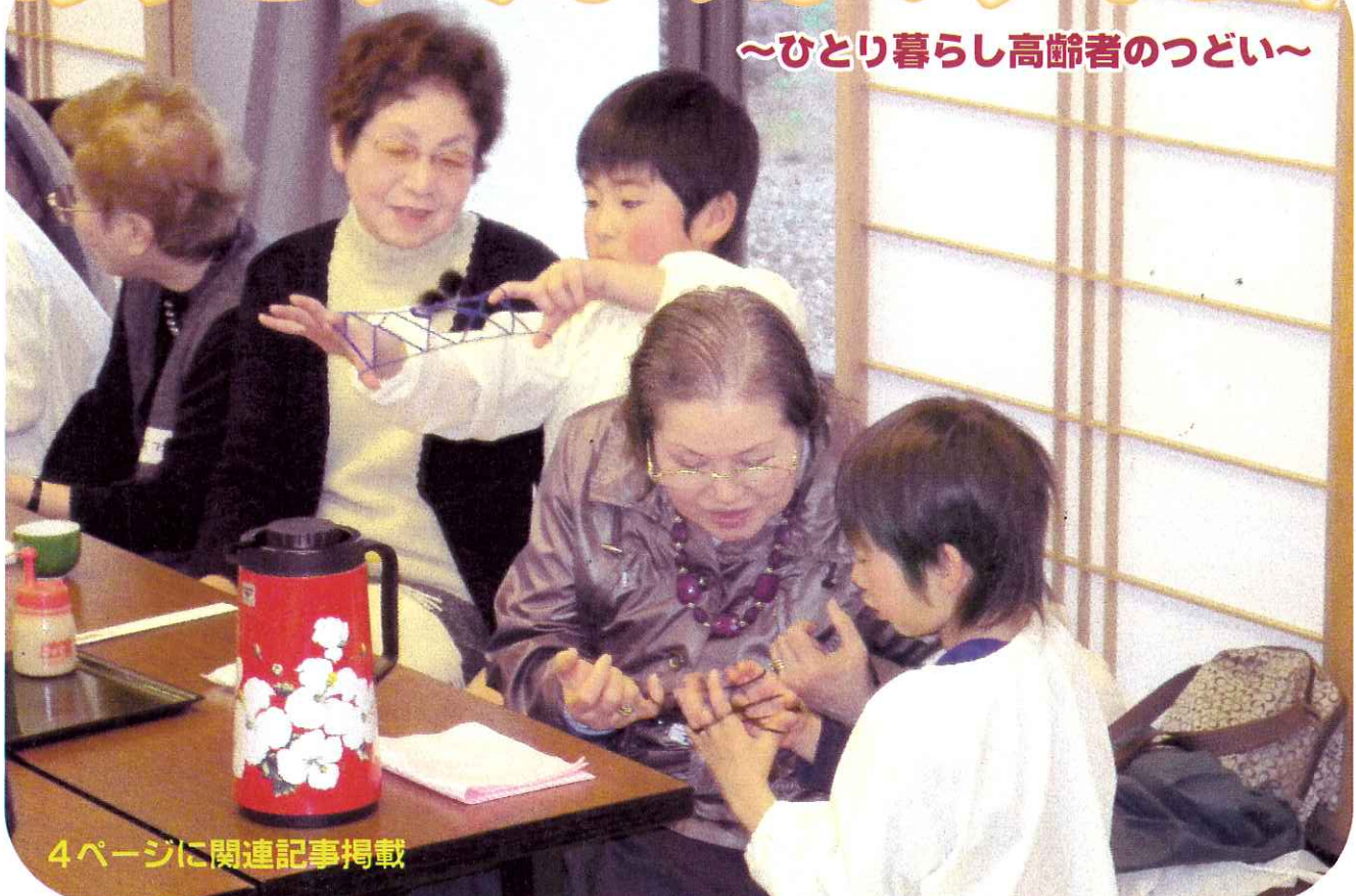
4ページに関連記事掲載