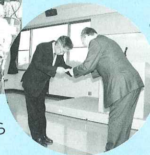
◀ 地域の福祉活動をすすめます。