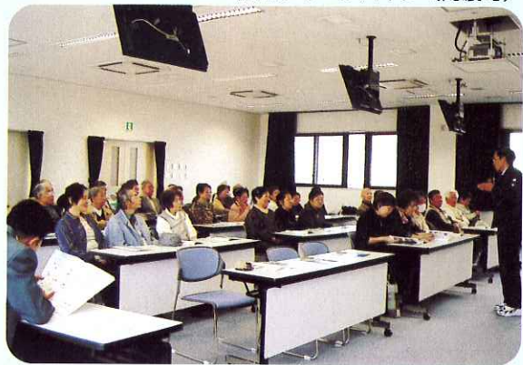
▲熱心に説明していただきました。