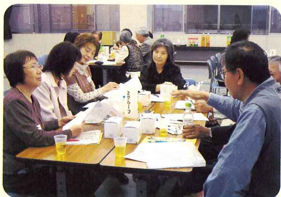
▲各サロンの「自慢話」をしながらの情報交換。

現在市内では29カ所のサロン活動が行われており、各サロンで様々な活動が行われています。