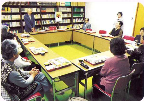
▲食事をとりながら親睦を深めました。

今月は懇親会として自治会長と民生児童委員、老人クラブの会長などが出席し、サロン参加者との交流を図りました。また、わくわくサロンではボランティアと参加者が一緒に企画・運営しており、懇親会の後に今年1年のサロン活動の計画を立てました。