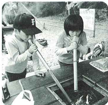
▲ふうふう、ほら、火がついたよ!