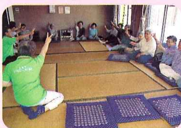
▲「ジャンケン、チョキ」と元気よく!

今回は海津市レクリエーション協会から先生を招き、みんなで輪になって後出しジャンケンや歌に合わせた手遊び、カラーリング通しゲームなどを行い、楽しいひと時を過ごしました。