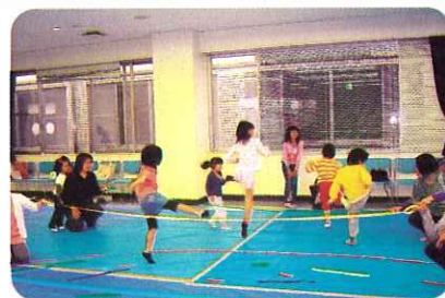
▲ジャンプ!!ジャンプ!!みんな頑張れ。

今年度は新入園児3名を加え、17名でのスタート。子ども達一人ひとりの成長を応援し、元気に過ごせるよう保護者の皆さんと、気持ちを確認し合うこともできました。