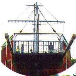
▶すべり台、気持ちよかったですよ!

子ども達はお互いに刺激し合い、達成感を得られたようで笑顔いっぱいの遠足になりました。