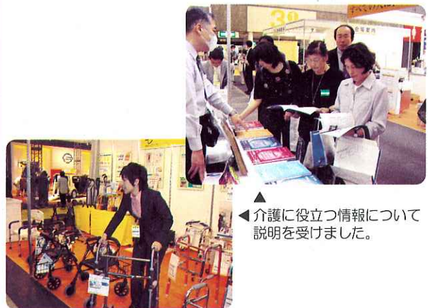
▲介護に役立つ情報について説明を受けました。

参加者は、普段の介護に役立てようと新しく開発された福祉用具や、身近な物を使ったアイデアグッズなど数多くの商品を手に取り、感触を確かめていました。