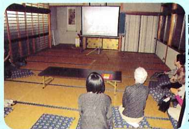
▲映画に心打たれました。

映画を観た後、お茶を飲みながら、障がいを持つということや自分たちにできる障がい者支援について話し合いを行いました。