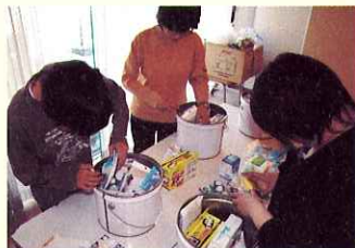
▲ 防災缶に商品を詰める利用者。