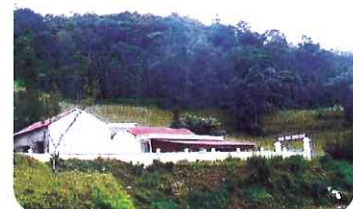
◀完成した幼稚園の外観