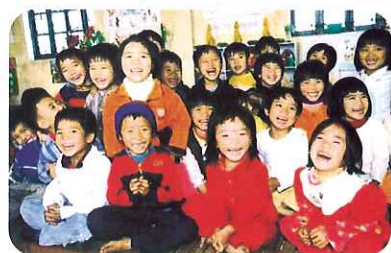
◀ベトナムの子どもたち