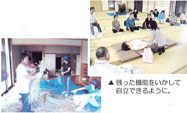
▲残った機能をいかして自立できるように。

9月27日(日)、馬目・西方地区合同の『健康運動・介護教室』が馬目集会所にて行なわれました。今回は、マヒのある人の衣類の着脱介助や認知症予防の体操、海津市ごまめ体操をおこないました。