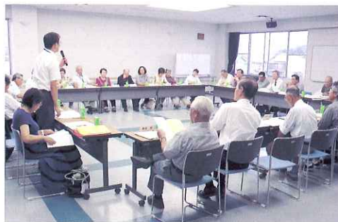
▲ 小学校区ごとの取り組みを報告しあいました。

9月28日に海津総合福祉会館ひまわりで、第5回かいづあいプラン推進委員会が開催されました。プランの重点施策である地区社会福祉協議会（地区社協）の創設や地域福祉懇談会の開催について、小学校区ごとに活動報告や情報交換をしました。