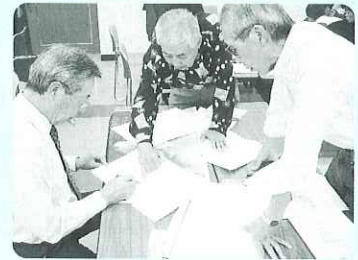
◀地区ごとに見守り体制を確認しました。▶