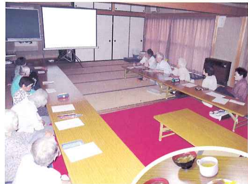
◀福祉映画に感動しました。