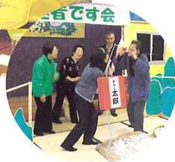
◀ 民生児童委員による手作り劇

昼食後、海津地区民生児童委員による「太郎さんとまわりの人々パート2」を鑑賞しました。この演劇は昨年披露した劇の続編となっており、今回も脚本から演出や舞台道具、衣装まで民生児童委員の手作りです。また、劇中では振り込め詐欺防止を訴え、歌や体操を混ぜ、笑いあいの楽しい劇を披露していただきました。