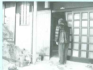
▲ 見守り活動の様子