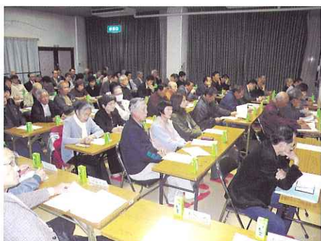
▲ 多くの参加者があった石津地区懇談会の様子

住民の声をもとに、福祉活動を行うという仕組みを、住民の手で作上げていくという内容に、これからの活動に対する期待の声や、さらなる協力を呼びかける声など、いろいろな意見が出されました。