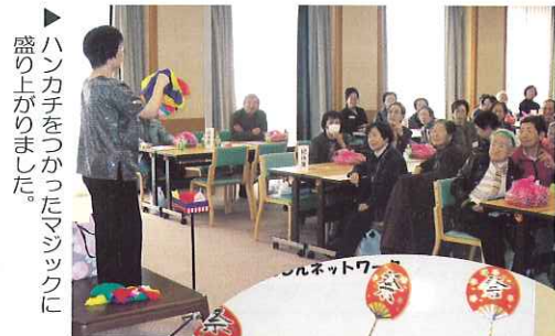
▶ ハンカチをつかったマジックに盛り上がりました。