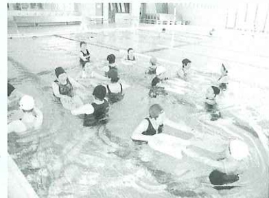
▲平成21年度水中コースの様子