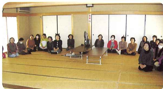
▲ ふくし映画を熱心に鑑賞しました。