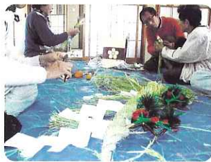
▶ 年末恒例のしめ縄づくり