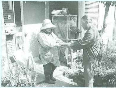
▲ 配食時の声かけの様子

このほかにも地域に根付いた活動や独自の見守り活動を行っている事例も多くあり、地域の福祉を担っております。