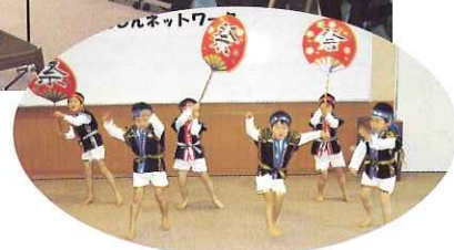
◀ 園児の力強いダンス!

2月25日(木)、ゆとりの森にて南濃地区ひとり暮らし高齢者のつどい～あんしんネットワーク～を開催しました。