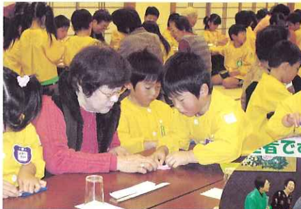
▲ 折り紙でふれあいました。

3月4日(木)、海津温泉にて海津地区ひとり暮らし高齢者のつどい～お達者です会～を開催しました。