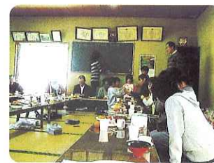
▶ クリスマス会を楽しみました。