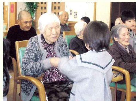
▶むすんでひらいて