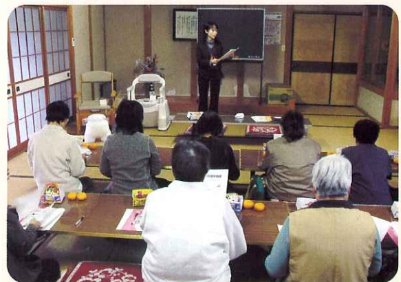
▲ 介護保険や介護用品について学びました。