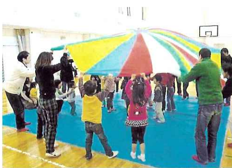
▶バルーンで遊んだよ。