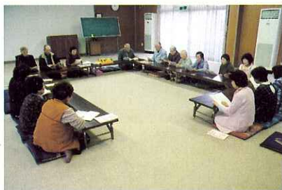
▲ 都道府県ビンゴゲームで楽しみました。

4月20日(火) おっはーサロンが開催されました。おっはーサロンは平田町高田自治会のサロン活動で、毎回ボランティアの皆さんが楽しいプログラムを考案し、笑いがいっぱいのサロンです。