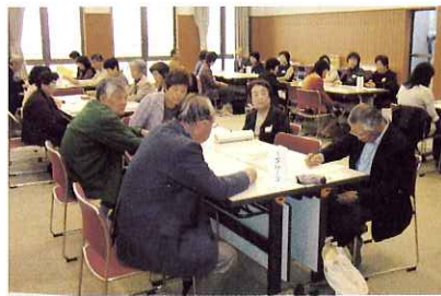
▲ サロンの運営方法について情報交換しました。

4月22日(木) 平田総合福祉会館で、ふれあいいきいきサロン代表者会議を開催しました。