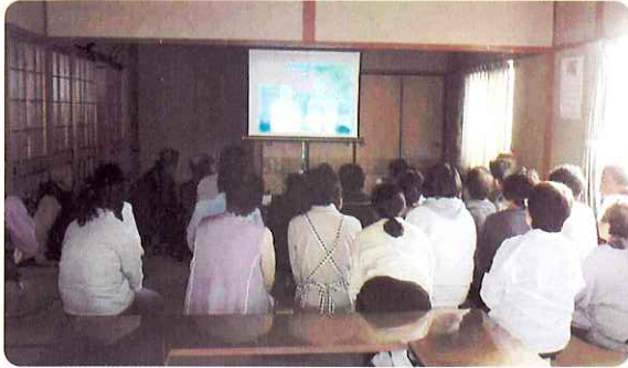
▲ 主人公の力強く生きる姿に感動しました。