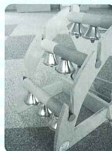
◀カラフルなベル すてきな音色です。

楽器あそびの中で、様々な音色を楽しみながら、子どもたちの表現力やコミュニケーションの力につながることを願って、大切に活用させていただきます。ありがとうございました。