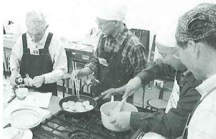
▲ レシピを見ながら協力して作りました。