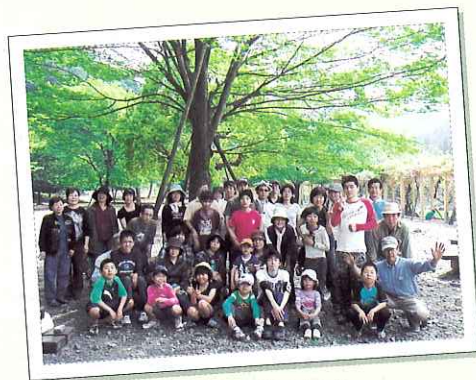
▲ みんなで記念撮影