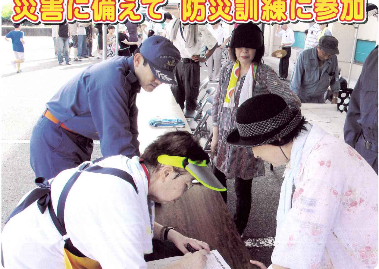
災害ボランティアセンターにてボランティア受付の様子