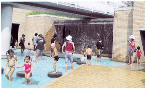
▶ 水あそびたのしいな

9月5日（日）愛知県児童総合センターへ大型バスに乗って遠足に行ってきました。見る・触る・聞く・嗅ぐなどの感覚を刺激されるような不思議な館内を、子どもたちは保護者の方と一緒に夢中になって動き回りました。また、水の広場で水遊びを楽しみました。