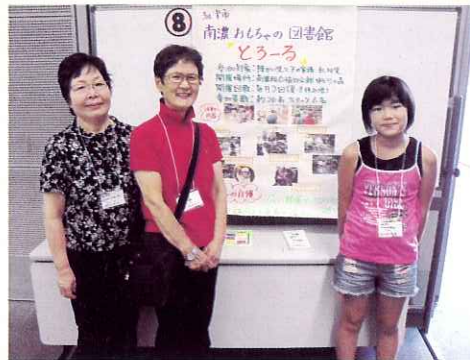
◀とろーるのボランティアの皆さん