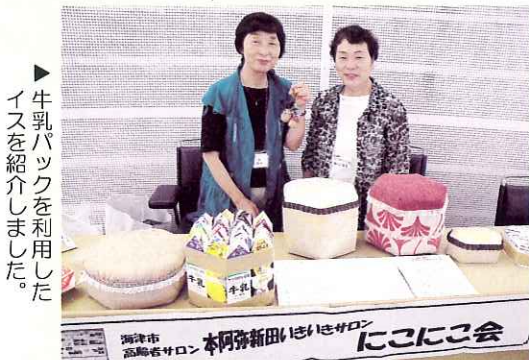
▶牛乳パックを利用したイスを紹介しました。

8月11日（水）県社協主催の岐阜県ふれあいいきいきサロン交流会が開催されました。当日は県内からサロン活動を行うボランティアさんが多く参加され、お互いのサロンの自慢話や苦労している点など意見交換をして交流を深めました。また、午後からのポスターセッションでは、県内で活発に活動を行っているサロンの紹介があり、市内から、「南濃おもちゃの図書館とろーる」と「本阿弥新田いきいきサロンにこここ会」のポスターや作品が展示されました。