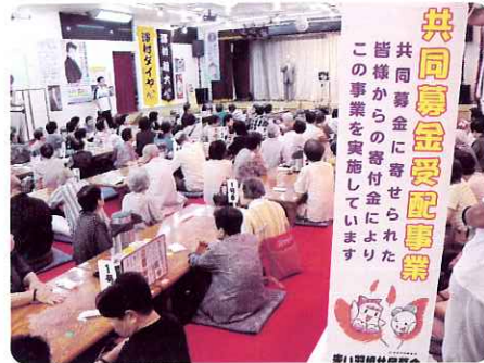
▶ 年に一度の交流会。楽しかったです。