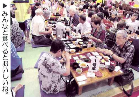
▶ みんなと食べるとおいしいね。