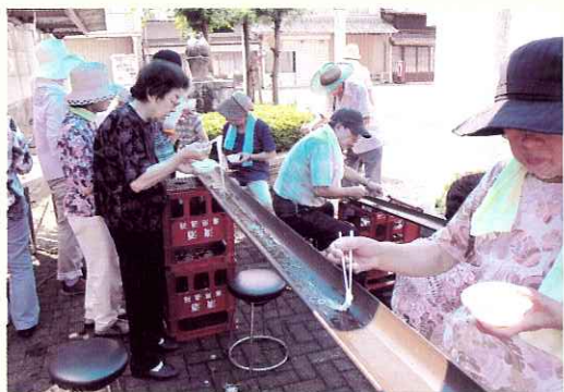
◀そうめんをナイスキャッチ！

当日は、そうめんの他、ボランティアさん手作りのおにぎりやスイカなどもいただき、参加者の皆さんは大変喜んでみえました。