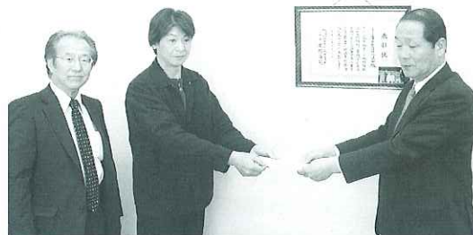
▲ 4月13日、桜ウォークin平田 実行委員様より義援金を受け取りました。

皆様のご協力ありがとうございます。 これまでに受付させて頂いた義援金は 951,686円 になりました。皆様から頂いた義援金は中央共同募金会を通じて被災者へ届けられます。引き続き、ご協力よろしくお願い致します。