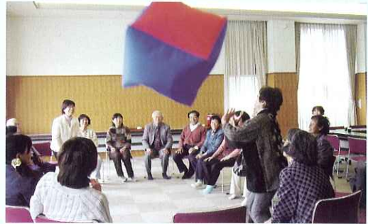
▲ザ・ストレス解消ゲーム 思わず夢中に!!