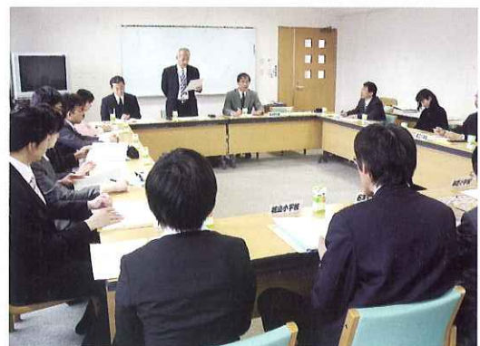
◀ 合同打ち合わせ会議の様子

また、福祉教育の進め方についても先生方がお互いに質問し合い、福祉協力校事業の活動の幅を広げるとともに、学校間の交流も図ることができました。