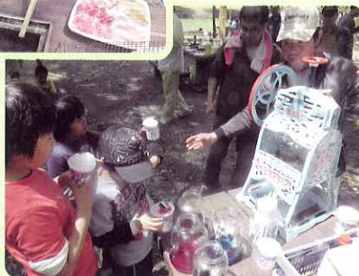
▲ かき氷の前に行列ができました