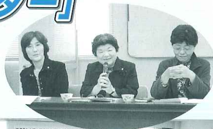
◀安心してご相談ください