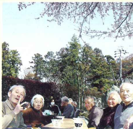
◀ 思わず顔がほころぶね!