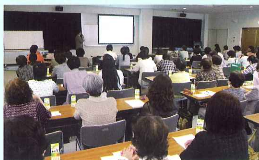
スクリーンを見ながら熱心に受講しました

6月3日(金) 食事サービスに関わるボランティアを対象に衛生講習会を開催しました。