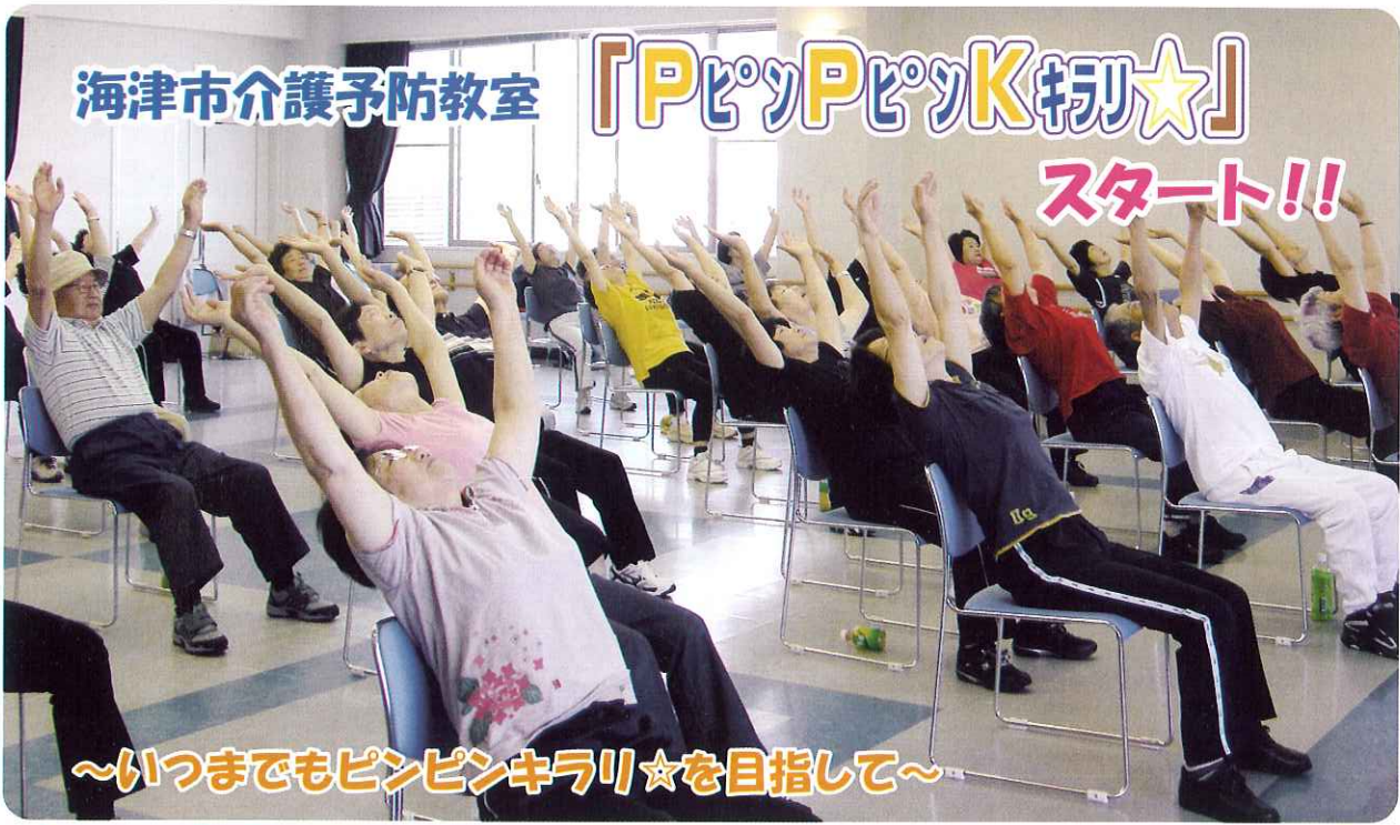
6月6日(月) 筋力トレーニングや有酸素運動を中心とした介護予防教室『発汗コース』が始まりました。参加者43名、平均年齢70歳で週1回3ヶ月間取り組みます。