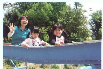
▲ ローラー滑り台楽しいよ

今回はたくさんのお父さん方が参加してくださりました。楽しい交流ができて意義のある行事となりました。