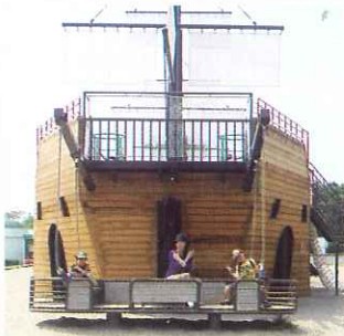
▲ 大きくて、かっこいい海賊船☆