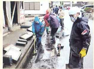
▲ 現地でのボランティア活動の様子

被災地で何か役に立ちたいと思っているあなた。 災害ボランティアに参加しませんか。