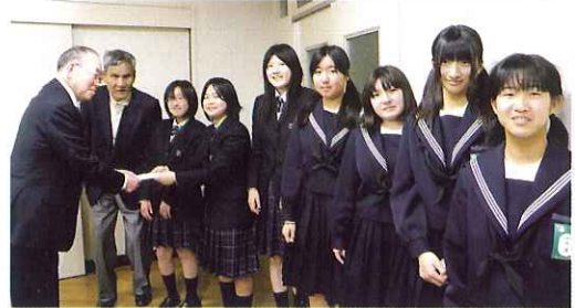
▲ 5月19日、アジア障害者の会様より義援金を受け取りました

皆様のご協力ありがとうございます。 これまでに受付かせて頂いた義援金は1,688,777円になりました。皆様から頂いた義援金は中央共同募金会を通じて被災地へ届けられます。引き続き、ご協力よろしくお願ひします。