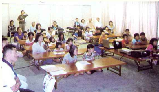
▶ 熱心にビデオ鑑賞する皆さん

参加者の皆さんは、被災地の現状を真摯に受けとめ、自分たちにできることは何かを皆さんで話し合っていました。