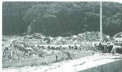
集められたガレキ

1日目はかつて町で一番賑わったといわれた地区での作業でした。作業は何軒かの家屋の土台板や床板を撤去し、また流れ込んだ土砂を取り除きました。次の日は海岸沿いの松林の倒木を運び出す作業でした。広い範囲なので一日で終わることはできませんでしたが、2日間とも全員暑い中、汗をいっぱいかきながら自分のできる範囲で懸命な作業をしました。バスの中からみた光景やボランティアの活動をみると、一日も早い復旧復興を願うばかりでした。その為にもボランティア派遣を継続し、一人でも多く参加してもらいたいと思います。