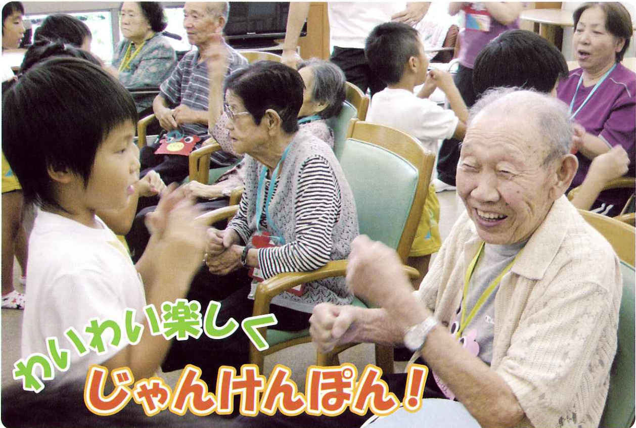
デイサービスセンター南濃(5ページに関連記事掲載)