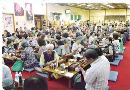
◀ みんなで食べるとおいしいね