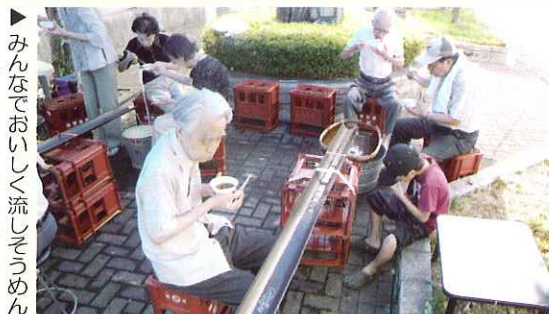
▶ みんなでおいしく流しそうめん

8月23日(火)、今尾ポケットパークで、スズランいきいきサロンが開催されました。