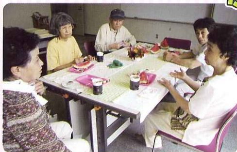
▶ わさあいらいと心とほぐしサロン

毎週第2木曜日、午後1時30分～3時まで、平田やすらぎ会館で「介護者ティーサロン」をやっています。