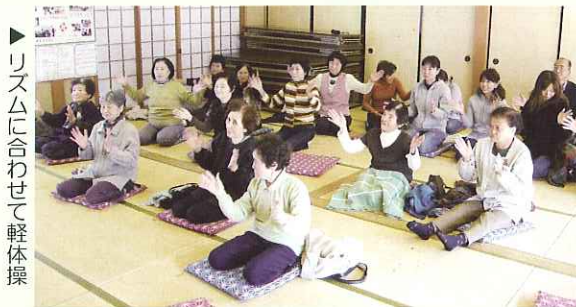
▶ リズムに合わせて軽体操