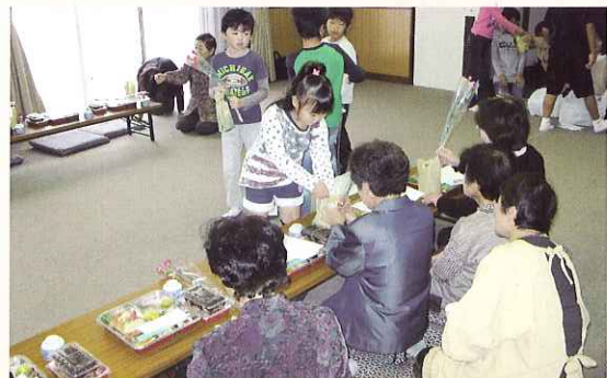
▶ プレゼントを渡す児童