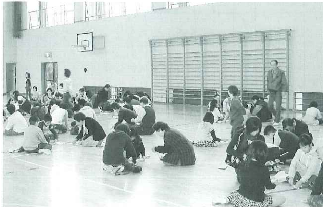
▶チームごとに紙飛行機を作りました