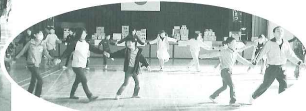
▲手をつないでマイムマイムを踊りました