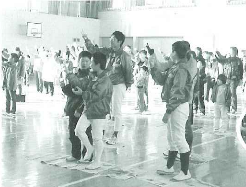
▲新聞おりおりジャンケンで盛り上がりました

今年で2回目となったこのレクリエーション企画は、自治会の輪を広げて地域の結束を深めることを目的としています。その他、Dブロック共通の幟旗を作成して街角に立ち、「笑顔であいさつ」を合言葉として、年末まであいさつ運動を実施しました。