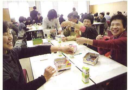
▲ 完成したプレスレットに喜ぶボランティアさん