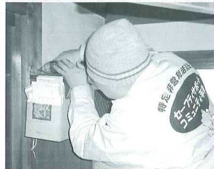
◀丁寧に転倒防止金具を取りつけるボランティアさん

地震などの災害対策として、海津工匠組合とセーフティサポートコミュニティ平田の皆さんが高齢者宅に訪問し、家具に転倒防止金具、火災報知器を取り付けました。この事業は、民生児童委員と福祉推進委員の協力のもと実施し、高齢者から「いつ大地震が起こるか分からない今、転倒防止金具や火災報知器を取り付けていただけるのは非常に心強いです。」といった声が聞かれました。