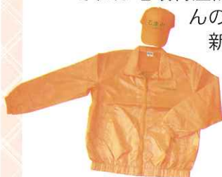
▲ 石津地区スクールボランティアジャンパーと帽子

また、石津地区社協では今後も児童の登下校を見守るスクールボランティアを随時募集しておりますので、ご協力いただける方は、海津市社協までお問い合わせください。