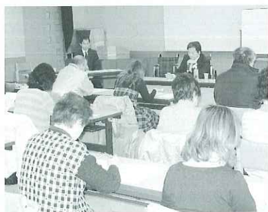
▲真剣に講義を受ける受講者さんたち

講座を終えて参加者から「車いす利用者が喜んでくれるような、優しい介助をしてあげたい。」といった感想が聞かれました。