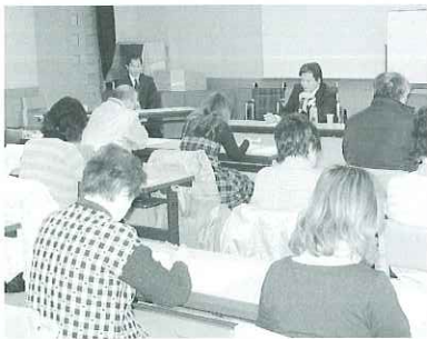
▲真剣に講義を受ける受講者さんたち

講座を終えて参加者から「車いす利用者が喜んでくれるような、優しい介助をしてあげたい。」といった感想が聞かれました。