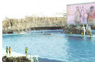
▲ イルカショーにわくわくしたよ