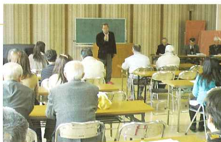
◀ 校長先生の挨拶に耳を傾ける住民の皆さん