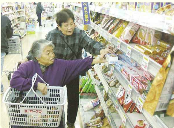
▲たくさん買いました！