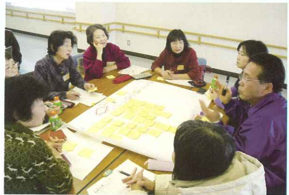
◀みんなが集まる事で新しい発見が