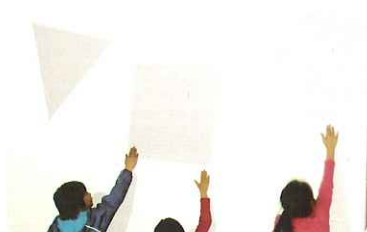
▲ 不思議! 動いていくね