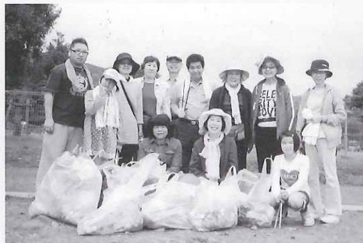
▶ 清掃活動を行ったボランティアのみなさん