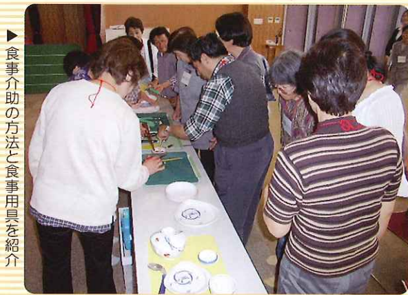
▶ 食事介助の方法と食器用品を紹介

数時間のうちに心がうちとけたようで、「次回も来ますね」とうれしい声がたくさん聞かれました。