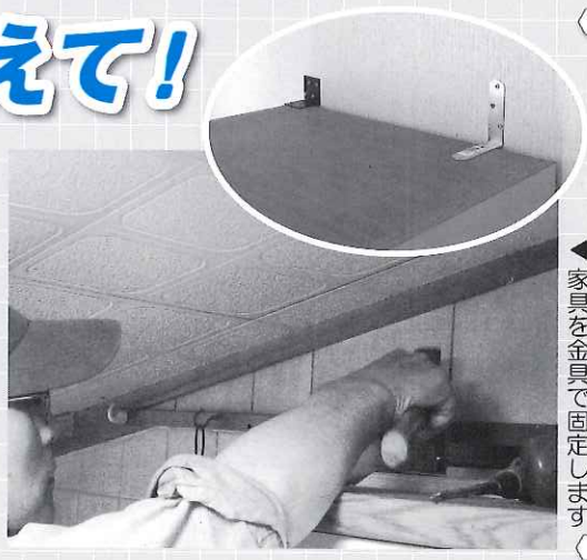
家具を金具で固定します