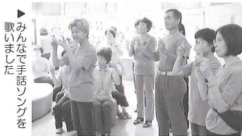
▶みんなの手話ソングを歌いました