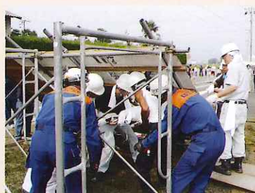
▲ 協力して負傷者の救出にあたりました

7月29日（日）日原と長久保の両自治会で構成する自主防災会の防災訓練が日原集会所にて行われました。