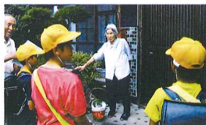
▲みんな笑顔で地域交流

地区社協としても安否確認や要援護者の支援に繋がる事業として、今後も積極的に参加していきたいと考えています。