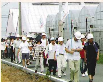
▲ 非難する住民の皆さん