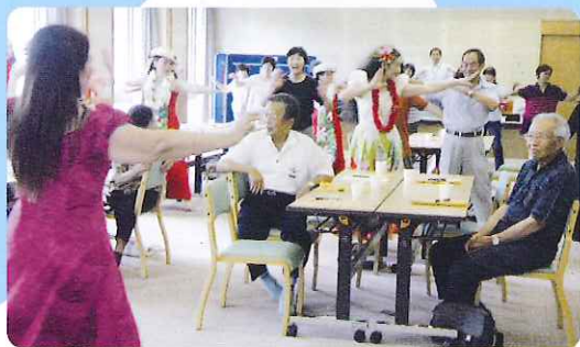
▲簡単な動きを教えてもらい 参加者も一緒にフラ、フラ、フラ・・・