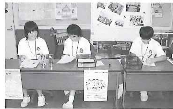
▶当日参加してくれた学生ボランティアさん

ステージ・体験コーナーでは、楽しい踊りやゲームなどが行われ、イベントが盛り上がりました。