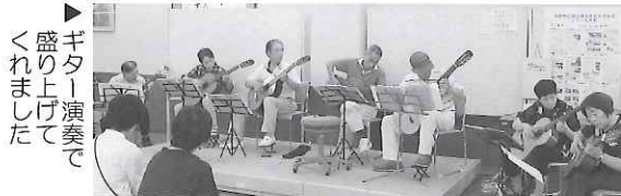
▶ギター演奏で盛り上げてくれました