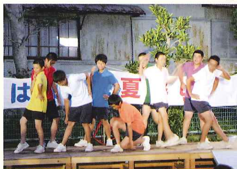
▲“平成時代”によるダンス「MR.TAXI」

また、チャリティービンゴ大会での収益を、東日本大震災義援金として共同募金会へ寄付をさせていただきました。今後も地域の方々との交流を大切にしていきます。