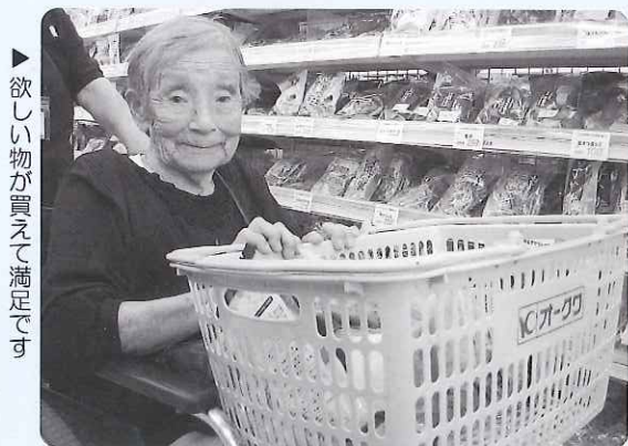
▶ 欲しい物が買えて満足です

デイサービスセンター南濃では、9月の2週目にオークワへ買い物レクリエーションを実施しました。利用者の皆さんは、何週間も前から買い物を楽しみにされていて、食品の他にも服や靴などを見て、買い物を満喫されました。