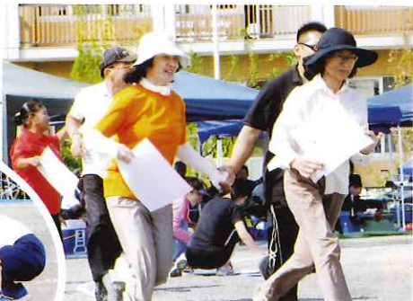
▲ 設立準備委員が出場した借り物競争