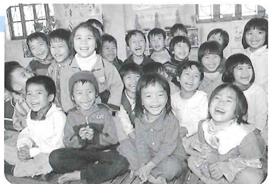
▲ベトナムの子どもたち