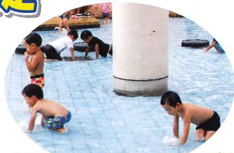
▲水遊びきもちいい