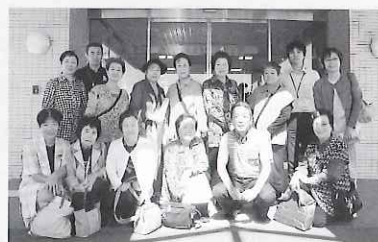
施設見学に参加したボランティアの皆さん

当日は12名が参加しました。各施設の職員から説明を受け、参加者は施設の良さや特徴をつかもうと熱心に聞いていました。また、ボランティア同士の交流も深め有意義な一日となりました。