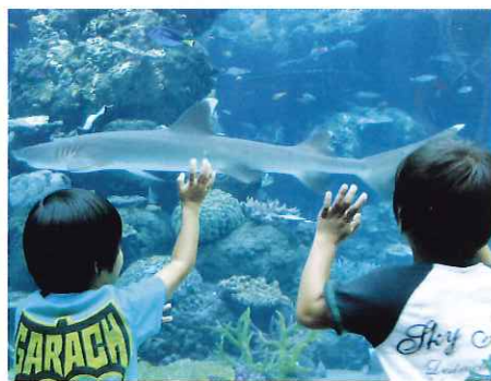
▲おさかなさわれそうであ〜

また教室の中とは違う子どもたちの表情をたくさん発見することができ、そして他の通園児の家族とも交流ができ、保護者の皆さんにとっても充実した1日となりました。