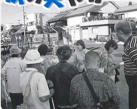
▲ ガイドさんの説明を聞いています

9月28日(金) 視覚障がい者のつどいを岐阜県視覚障害者海津支部との共催で開催しました。