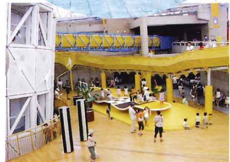
▲館内は遊びがいっぱい