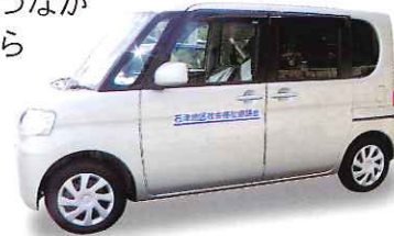
送迎サービス用自動車