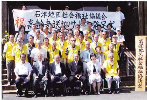
送迎サービスが始まります