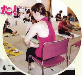
▲ 全身がほぐれるのを実感、毎回あっという間の1時間半でした