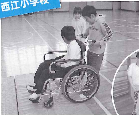
▲ 段差はゆっくり押します