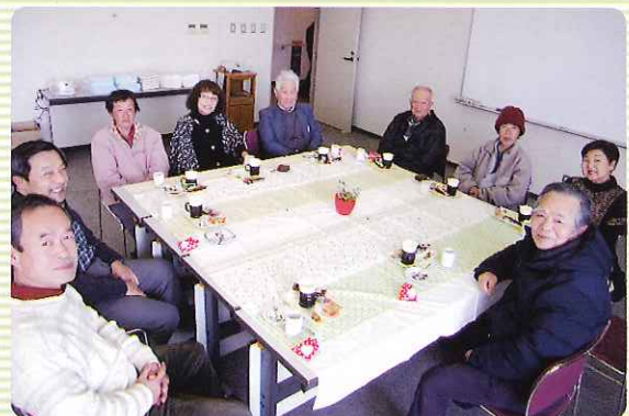
▲ あたたかいコーヒーを飲みながら、 介護話に花が咲きます

毎月第2木曜日、午後1時30分から3時まで、平田やすらぎ会館で「介護者ティーサロン」を開催しています。在宅で介護をしている方ならどなたでもご参加いただけます。申し込みは不要で出入り自由、時間のある時にふらっと寄ってお話いただけます。介護経験者(元介護者)の方も大歓迎!身近な経験談やアドバイスを聞かせてください。