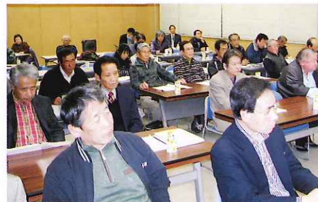
今後地域に根ざした活動を行っていきます