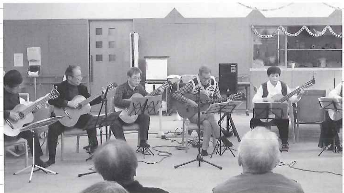
◀ 素晴らしい演奏を披露してくれました

1月17日(木) デイサービスセンター南濃で海津ギター同好会によるギター演奏会が開かれました。平成22年12月に発足した海津ギター同好会は、ギター好きな17名が集まり活動しています。この日の演奏会では、昔懐かしい名曲を演奏し、その素晴らしい音色で利用者皆さんの心を惹きつけていました。