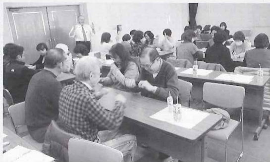
◀ グループに分かれてレクリエーションを楽しみました