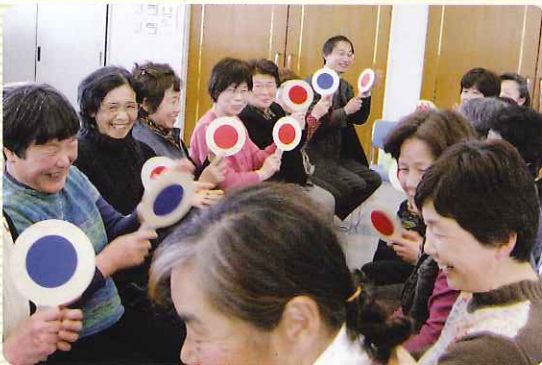
▲ リフレッシュタイムの様子 ボールも「笑い」も転がりました!

20回目となる介護者サロン、今回もたくさんの方にご参加いただきました。長年介護していらっしゃる方、介護が始まったばかりの方も一緒になっての交流会、「気がつくひとりでは考え込んでしまっ...」「良い介護の方法が分からない。」「私もそうだったわ!」など話はずみません。初めての参加で少し緊張気味だった方も「介護の先輩のアドバイスに、肩の力が抜け気持ち楽になりました。また参加したいです!」とニコリ笑顔で帰られました。