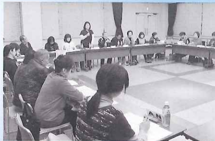
◀ 来年度に向けて活発に話し合いました

ボランティア同士のネットワークがさらに深まり、来年度に向けて有意義な会議となりました。