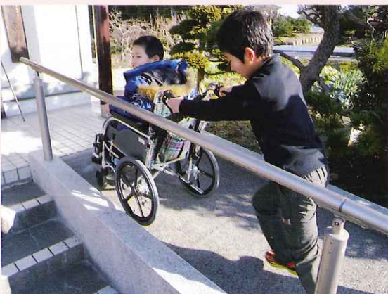
▶相手の気持ちを考えて介助しました