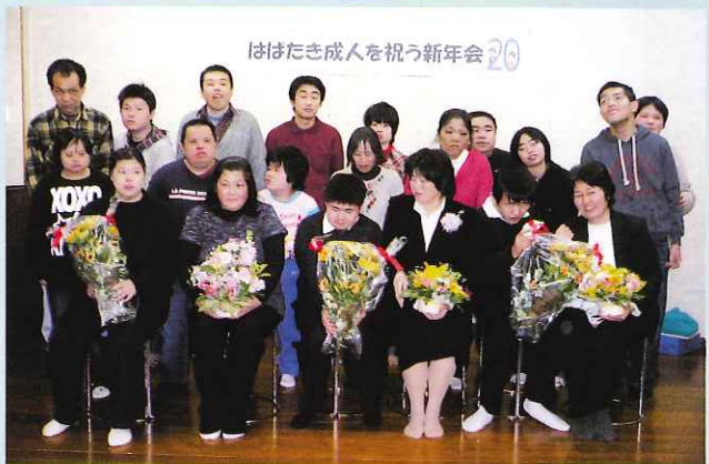
◀ 新成人を囲うはばたきの仲間たち