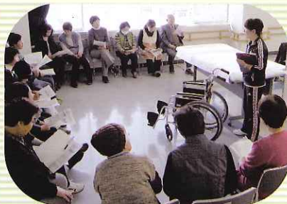
▲ 家族介護者教室の様子 体に負担の少ない移乗介助の紹介