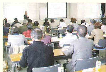
▲ 地区福祉活動報告の様子