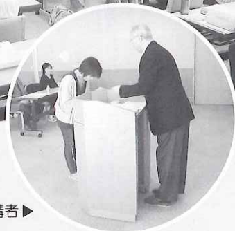
修了証を受け取る受講者▶