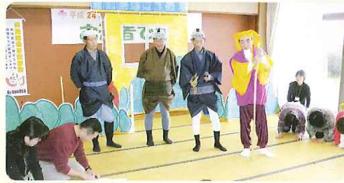
◀ 寸劇でわかりやすく

最初に、高須認定こども園の園児たちがフラフープダンスや絵描き歌を次々と披露してくれました。また園児たちは参加者の中に入り、一緒に絵を書いたり手遊びをしたりして遊びました。