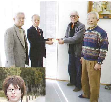
◀ Love Music Club様から義援金を受け取りました

昨年夏のハワイアンコンサートと今回のコンサートの参加費・募金を合わせた4万円を、海津市社会福祉協議会を通して被災地の岩手県大槌町社会福祉協議会へ義援金として届けました。