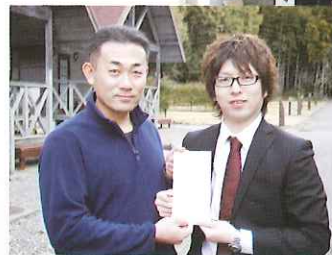
◀ 大槌町社協へ義援金を直接手渡しました