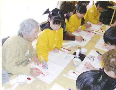
▶ おばあちゃん、一緒に絵を書こう!