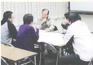
▲ 民生児童委員との地区懇談会

また、委員会の後半には、見守りマップを活用して、民生児童委員との地区別懇談会を行いました。地区内に住む要援護者の情報を交換して今後の支援方法や見守り方法について検討しました。福祉推進委員会は年に3～4回開催しており、民生児童委員との懇談会やスキルアップのための研修を企画し、地域福祉推進の向上を図っています。