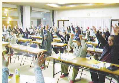
▲ 介護予防教室の様子