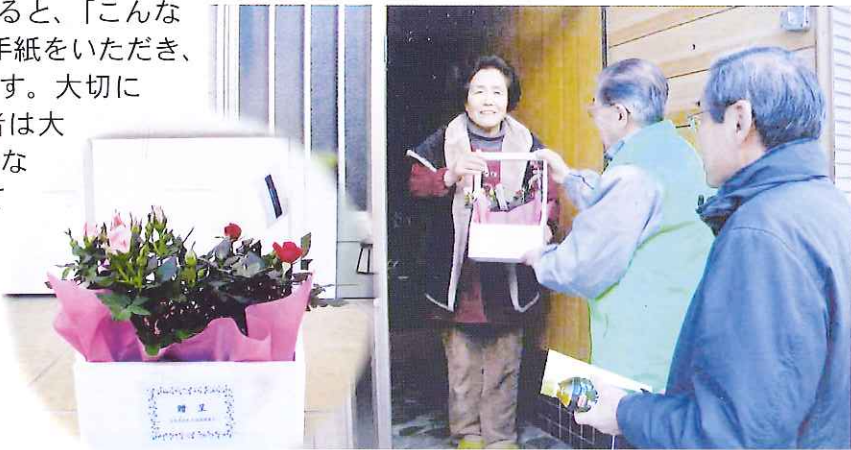
▲ひとり暮らしの高齢者にプレゼント