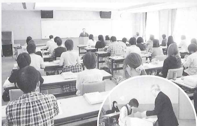
真剣に授業を受ける受講者たち