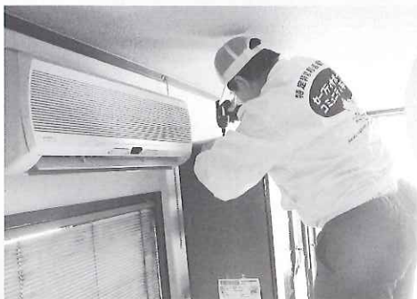
▲ 転倒防止金具を一つひとつ丁寧に取付けるボランティアさん