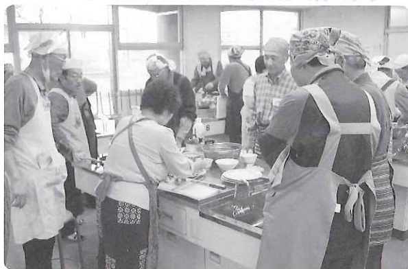
▲ 先生の手際の良さにホレホレしました

4月24日(水)海津総合福祉会館において、介護予防教室へ新たに加わえられた「めざせ！ 厨房男爵 入門コース」を開講しました。