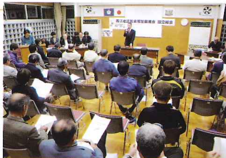
◀小岩会長の挨拶の様子