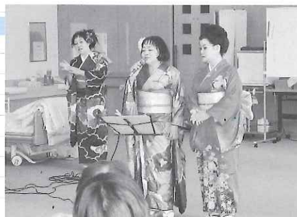
◀ 南濃一座のみなさん

4月18日（木）には海津市デイサービスセンター南濃にて「南濃一座」による歌謡ショーが開かれました。歌や踊りを披露され、デイサービスの利用者さんから手拍子と拍手が響きました。