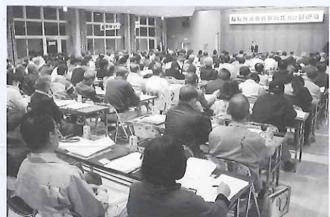
▲福祉推進委員の役割について熱心に耳を傾ける委員の皆さん

委嘱を受けられた福祉推進委員の皆さんは、研修会においても市社協の概要や委員としての役割説明に真剣な面持ちで耳を傾けていました。今後、ひとり暮らし高齢者等の見守り活動や地区福祉活動の推進者として、民生児童委員や行政、市社協などと連携をとりながら活動を進めていきます。