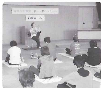
▲ 足のこりを揉みほぐします