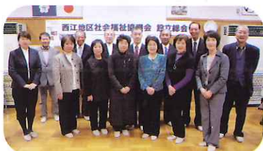
▲西江地区社協設立準備委員の皆さん

今年度の西江地区社協事業計画は、昨年度西江地区策定委員会で課題が挙げた「西江小運動会への地域参加」と「サロン啓発・交流会」そして「三世代交流事業」について事業を実施する予定です。