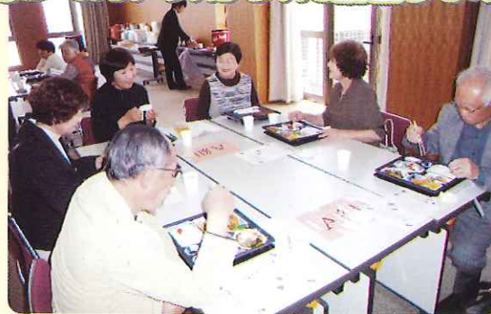
◀仲間と過ごす、ホッと一息