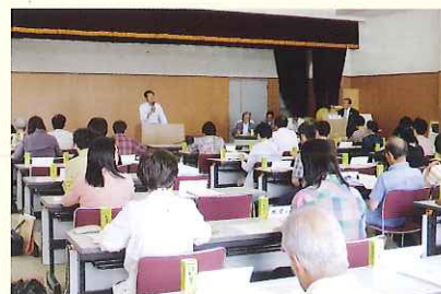
▲ 平田地区福祉推進委員会