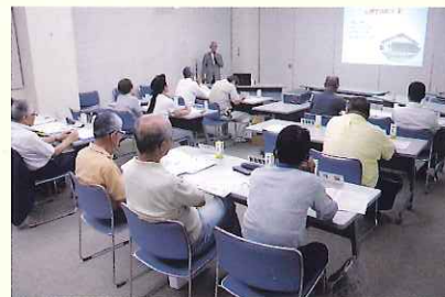
▲ 下多度地区福祉推進委員会