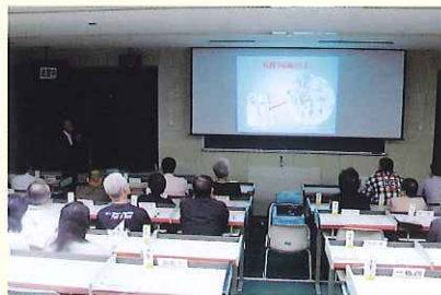
▲ 城山地区福祉推進委員会

また、この福祉推進委員会には民生児童委員の皆様にもご出席をいただき、地区別の懇談会も同時に開催しました。懇談会では、民生児童委員と福祉推進委員の連携について活発な意見交換が行われました。