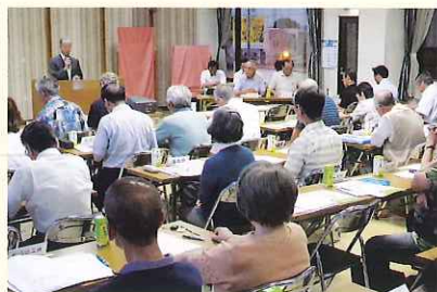
▲ 石津地区福祉推進委員会