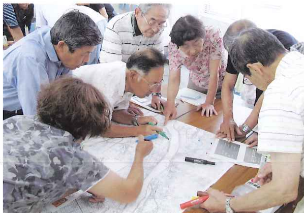
▲ 相談しながら色分けをしています

今回は、区長・自治会長をはじめ、民生児童委員、福祉推進委員、地区社協役員等地域で活躍している方々に多く参加していただきました。それぞれの地区に戻って、地域防災を広めていただきたいと思います。