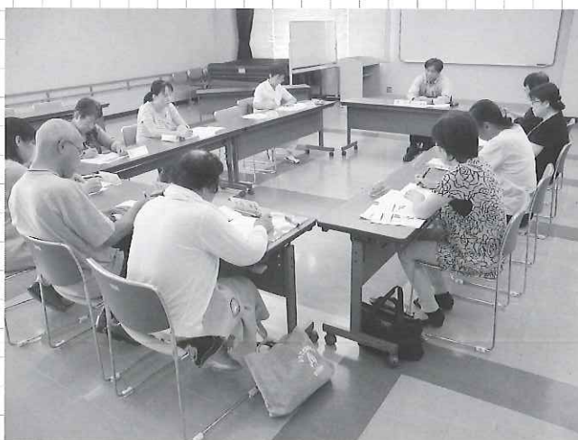
▲熱心に先生の話を受講生