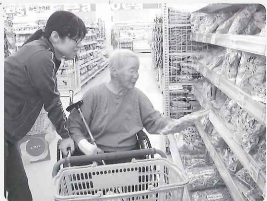
◀「これを買おうか」と

海津市デイサービスセンター南濃では、6月17日から21日の間、オークワ養老店へ行ってきました。皆さんはそれぞれ袋いっぱいにお買い物をされ、笑顔で「息子に買ったんや」「孫に買ったんや」と話されていました。センターに帰ると「楽しかった！また連れてってね！」と喜びのお声を頂きました。