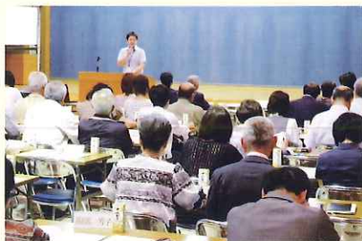
▲ 海津地区福祉推進委員会