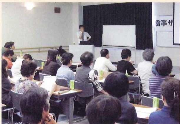
▲ 講師の話を熱心に聞くボランティアの皆さん

参加したボランティアは、「細菌やウイルスの多さに驚いた。食中毒は身近にあると教わったので、普段から手洗いや消毒に気をつけるよう心がけたい。」と感想を話していました。