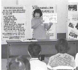
▲クイズ形式での紙芝居