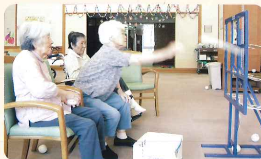
◀あと1枚! 頑張ってる!

この日はストラックアウト(野球)を行いました。利用者さんたちは、的を狙ってボールを投げ続け、見事全部打ち抜かれると、手を上げ「やったー」ととても喜ばれていました。