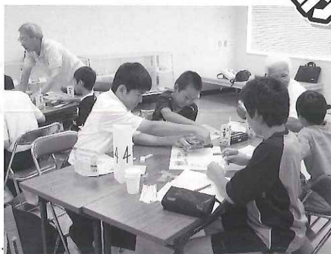
▶グループワークの様子

夏休み期間を利用して、市内に通う小中学生、高校生を対象にボランティアスクールを開催しました。ボランティアスクールは、ボランティア体験学習を通して共に学び合い、福祉に興味や関心を持ってもらうことを目的としています。