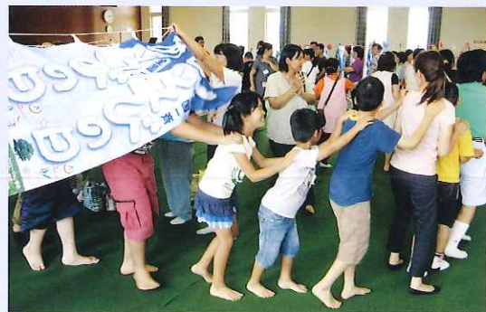
長い輪ができました

参加者は楽しい時間を過ごし、短冊に込めたそれぞれの思いが天に届くことを願いながら、会を終えました。