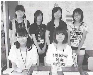
▲手伝ってくれた 学生ボランティアさんたち