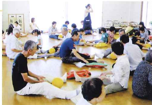
健康体操で夏ハテ防止！

最後は、参加者でカレーを食べながら、不安に感じていることや困っていることを話し、また地域の見守り活動や災害弱者への対応についての意見交換をしました。